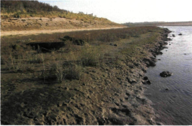
Figuur 1 : Algemeen beeld biotoop & habitat bij laagwater; rechteroever zwingeel. (31/10/2014)