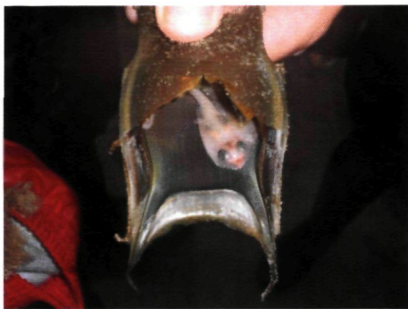
Foto 2: stekelrog Raja clavata met daarin een mini rogje

Op 24 oktober deed Dirk Laga tijdens het gidsen te Oostende Mariakerke in de vloedlijn een niet alledaagse vondst, een vers eikapsel van een stekelrog Raja clavata met daarin een mini rogje (foto 2 en 3).