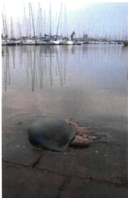
Foto 4: Zeepaddenstoel Rhizostoma pulmo Nieuwpoort 092014

Op 13 november 2014 werd een groep van 20 Noord-Atlantische Grienden Globicephala melas gespot in de buurt van Blankenberge door Simon Feys, Bart Van Gelder, Bram Conings, Jeremy Demey en Karel Boey.