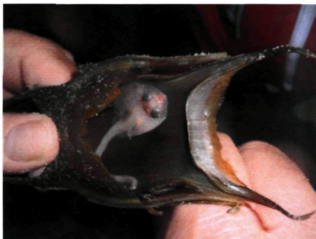
Foto 3: stekelrog Raja clavata met daarin een mini rogje