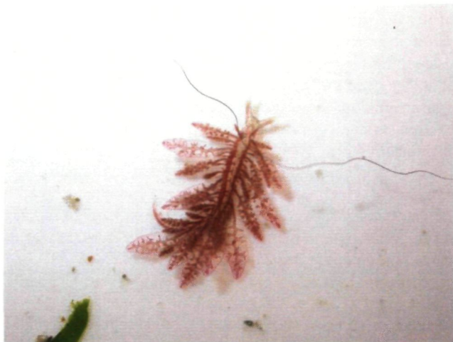
Foto 1: Slanke rolsprietslak Hermaea bifida

Macoma balthica , Amerikaanse boormossel Petricolaria pholadiformis , een Wijde mantel Aequipecten opercularis , 2 levende Wenteltrappen Epitonium clathrus en tienduizenden Muiltjes Crepidula fornicata die op alles en nog wat zijn vastgehecht. René Billiau heeft wel af en toe een paar levende Zaagjes Donax vittatus in het kruinet maar op 11 november 2014 waren het er 250 in De Panne ! Op 1 september vond Aäron Fabrice een stuk plastic met jongs Wijde mantels op het strand Van Oostduinkerke.