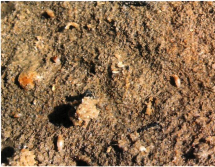
Figuur 5 : Detail van wit muizenootjes op onderzijde steen. (17/9/2014)