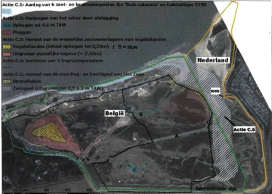
Kaart: Uitvoeringsplan van de Zwin Tidal Area Restoration-werken wm = vindplaats wit muizenootje.