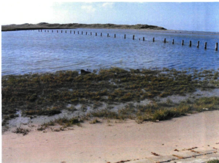
Figuur 3 : Habitat nog gedeeltelijk overspoeld na extra hoog tij. (9/10/2014)