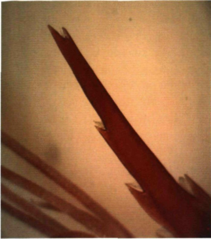
Figuur 1: Een gewone rostrumtop