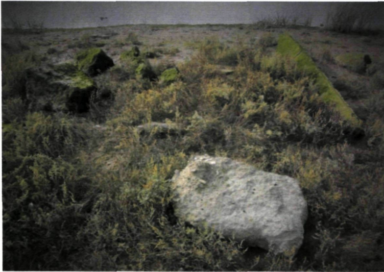
Figuur 2 : Detail van het habitat (steen vooraan ligt omgedraaid). (17/10/2014)