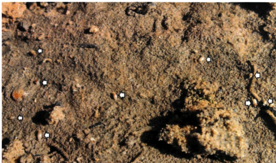
Figuur 4 : Algemeen beeld van wit muizenootjes op onderzijde van gekeerde steen. (17/9/2014)