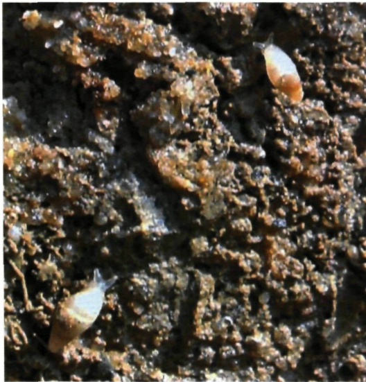
Figuur 6 : Close-up van levende wit muizenootjes. (17/9/2014)