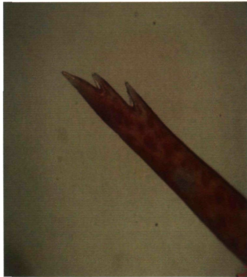
Figuur 3: Rostrumtop met twee tanden