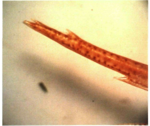
Figuur 2: Top van rostrum met twee tanden