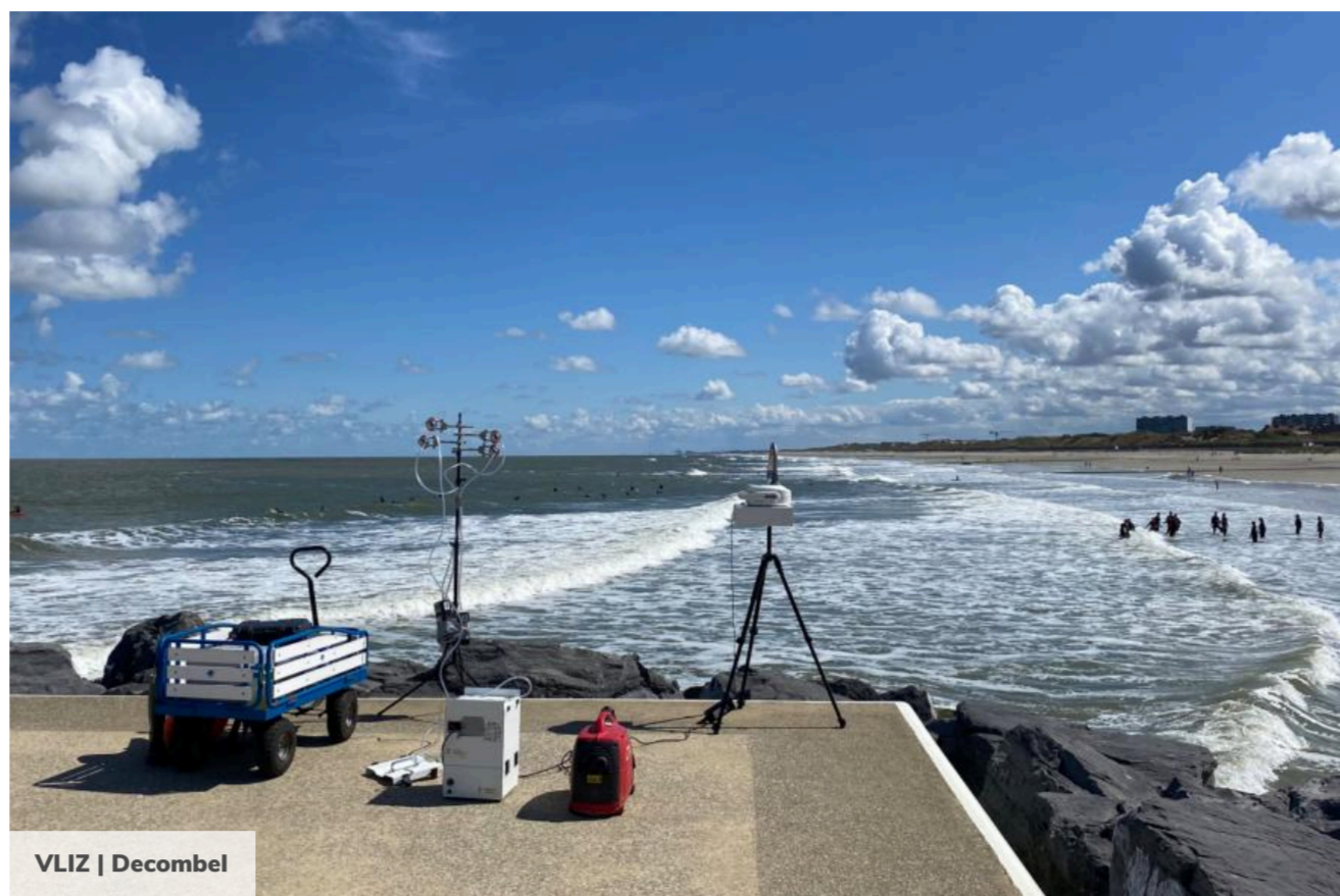
VLIZ | Decibel