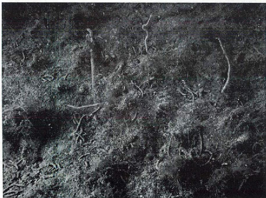
Foto's 1 en 2. Amphiura brachiata , Oosterschelde.