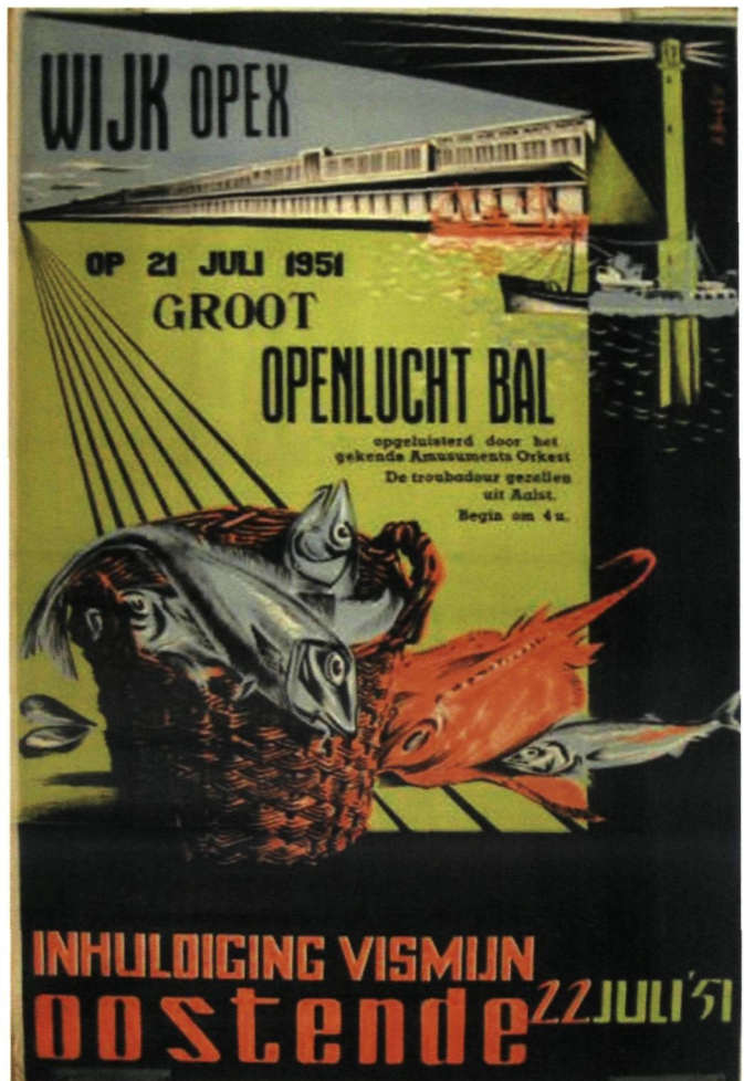
De opening van de heropgebouwde vismijn in 1951 ging gepaard met grote feestelijkheden. In de Opex werd een openluchtbal georganiseerd.

De kapitaalbreng van de NV Zeebrugse Visveiling (1988) was ook de start van een meedogenloze competitie om zich de resterende brokken van de Belgische visserij toe te eigenen. In die concurrentiestrijd moest eerst de Oostendse rederscoö-