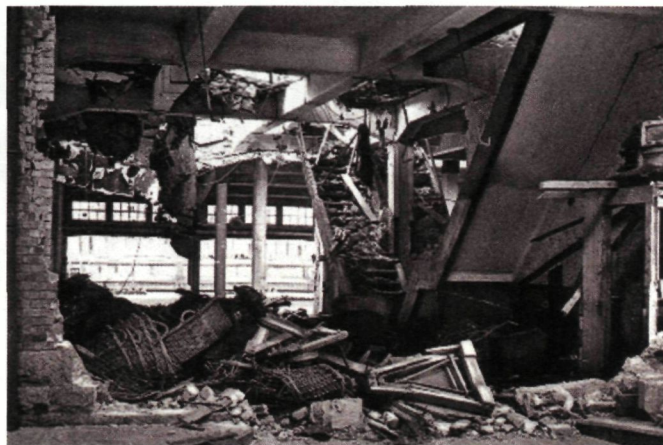
De stad Oostende had hard te lijden onder het geweld van WO II. Ook de vismijn op de Oosteroever werd vernield.

Het had lang geduurd. Maar daar zat WO I natuurlijk voor veel tussen. De Duitse legers trokken op 15 oktober 1914 de stad binnen. De haven zou daardoor aan beschieting bloot komen te staan. In de inmiddels verdwenen oud-vuurtorenwijk, ten oosten van de stad, alleen al vallen 38 dodelijke burger-slachtoffers.