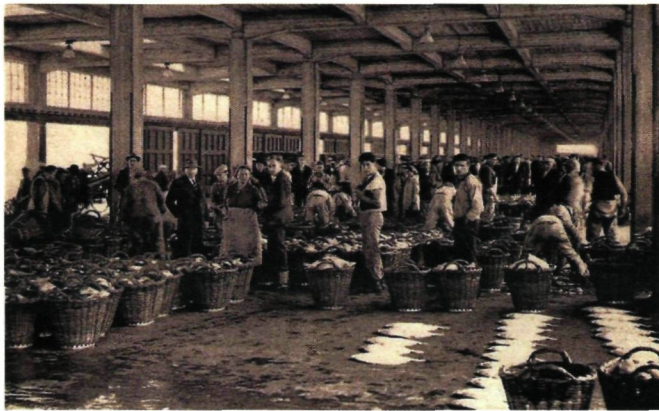
De Oostendse vismijn in 1953. Nooit was er zoveel visserijbedrijvigheid in Oostende als tijdens de jaren vijftig en zestig.

Nooit was er zoveel visserijbedrijvigheid in Oostende als tijdens de jaren vijftig en zestig. Ook vandaag zijn er nog altijd mensen die zich de tijd herinneren waarin de vismijn haast te klein was om er alle vangsten in onder te brengen. Vanaf de jaren zeventig werd het duidelijk dat de gouden