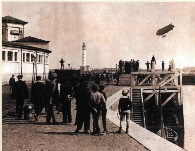
1914. Het Britse luchtschip Astra Torres vliegt boven de haven van Oostende, op weg naar Frankrijk. Links zien we de oude vismijn (de 'cierk'). Op de achtergrond: de eerste vuurtoren die op de Oosteroever gebouwd werd.