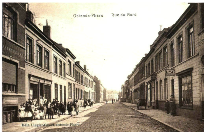
Edit. Lingier-Guzet, Ostende-Phare

De wijk 'ontplooidde zich in de driehoek gevormd door de reeds in