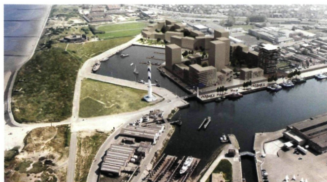
Zo zal de site van het negerdorp, aka de Oostendse Oosteroever, er volgens de projectontwikkelaars in de toekomst uitzien.

Dat de wijk een grote aantrekkingskracht op kunstenaars uitoefende verwondert ons niet. Het volkse karakter, de nabijheid van de zee, de maritieme bedrijvigheid... Dat alles trekt daar ook nu nog artiesten aan. Vandaag kun je er de kunstschilder Thierry De Cordier in zijn atelier aan 't werk zien. Al sinds 1907 waren er plannen om in Oostende een nieuwe