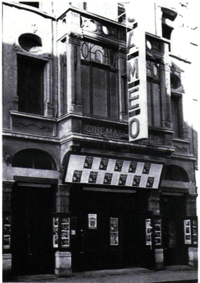
De Cameo (1920-1966) lag vooraan in de Kapellestraat en werd druk bezocht door matrozen die in de nabijgelegen kazernes gelegerd waren. 708 fauteuils, vijf loges (de 'vrijerskotjes'), 2 balkons (waarvan de bovenste het kiekenkot genoemd werd).