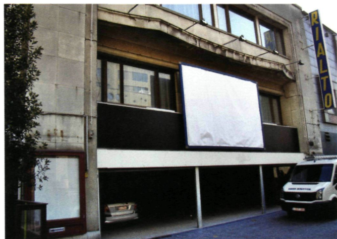
In Oostende sloot de laatste stadscinema de deuren. De cinemareclame van de Rialto (1928-2012) werd vervangen door een wit blad.

Over Cleopatra VII , koningin van Egypte, werden meer dan twintig films gedraaid. In Oostende werd een vissersvaartuig naar haar genoemd. De O 182 werd dan weer genoemd naar haar geliefde Ceasar.