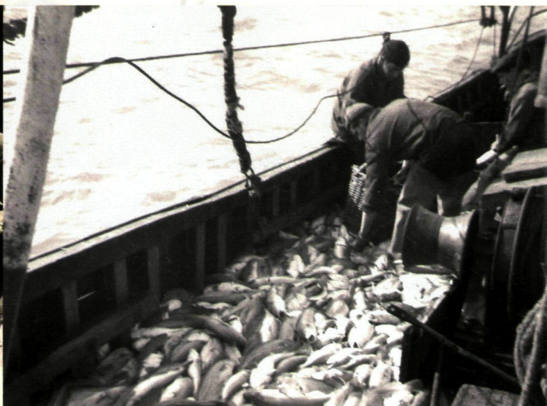
In de jaren zestig werd er ook vis gevangen die vandaag geen markt meer kent. Op de foto lossen kustvissers hun gevangen sprout.