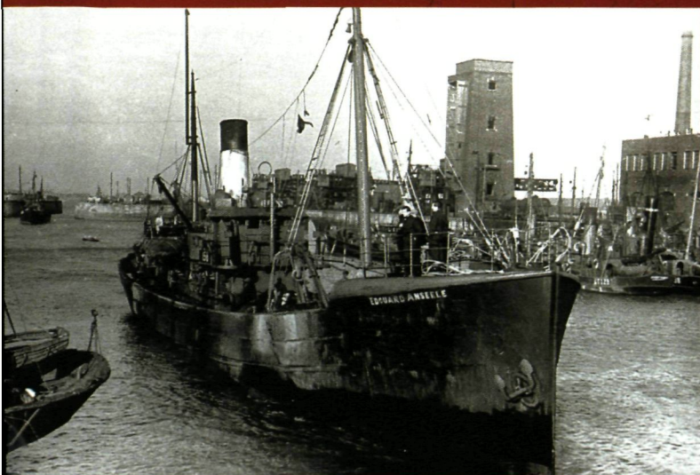
Het eerste stoomschip van de Rode Vloot werd genoemd naar de Gentse socialistische voorman Edward Anseele, die het project mogelijk maakte.