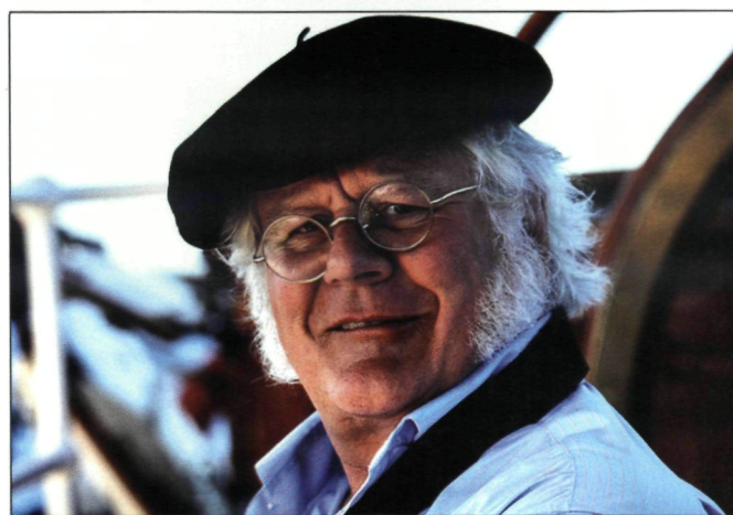
Het ging er soms hard aan toe in het uitgangseven van de vissers. De Britse auteur O'Hanlon heeft er een uitleg voor.

Let wel, cultuur is geen synoniem van lieflijkheid. Er werd in die kroegen wel meer gedaan dan verteld, gezongen