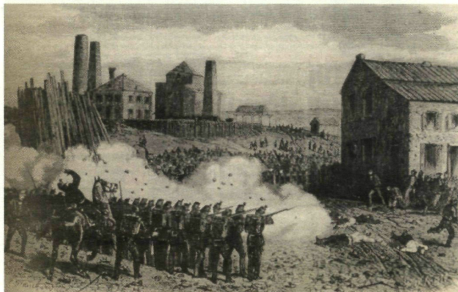
De Oostendse vissersopstand van 1887 past in sociale beroeringen die ook elders in het land plaatsgrepen. In 1886 schiet de burgerwacht in Luik op een spontane betoging van arbeiders. Balans: twee doden en 47 arrestaties. In Charleroi chargeert het leger tegen opstandige arbeiders: twee doden. In Roux gebeurt hetzelfde: tien lijken blijven op de straat achter. In maart 1886 vallen er tijdens al die rellen in totaal 24 doden. Op de foto. De staking van de mijnwerkers van Epine (maart 1886) wordt met geweervuur onderdrukt. De vergelijking met heet beeld van de Oostendse vissersopstand is opvallend.