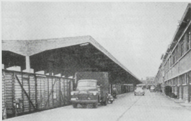
Oostende was in de jaren vijftig daadwerkelijk een draaischijf van de Europese visserij. Op de foto ziet u links de legendarische vistrein die vanuit de Vismijn het continent met verse vis bevoorraaide. (Uit 'Het havencomplex van Oostende', 1955.)

En ook in Zeebrugge past het de woorden van filosoof John Gray uit te spreken. Ook daar is de werkelijkheid maar moeilijk te verdragen, want die luidt: het is niet omdat ze erop vooruitgegaan is dat de ZV deze bikkelharde strijd gewonnen heeft, het is omdat concurrent Oostende de witte vlag uitsteekt. De Vismijn van Oostende hangt in de touwen. Ze zit in dezelfde netelige