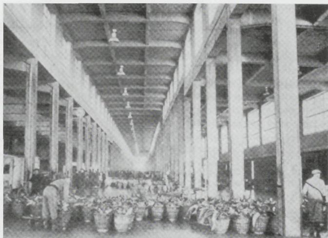
De Oostendenaars leverden in die tijd jaarlijks 55.000 ton zeevoedsel aan de vismijn. Vergelijk: dit jaar zet de héle Vlaamse visserij ongeveer 15.000 ton op de marktloer van de drie vismijnen. (Uit 'De evolutie van de Oostendse vissershavens' 1957.)

Nadat de ingedommelde Oostendse rederscoöperatieve OVA (die toen in Oostende de veilingactiviteiten organiseerde) haar toch al tot op de draad versleten handdoek in de ring gegooid had, kreeg de Vismijn daar onverwachts een nieuwe dynamiek. De nieuw opgerichte