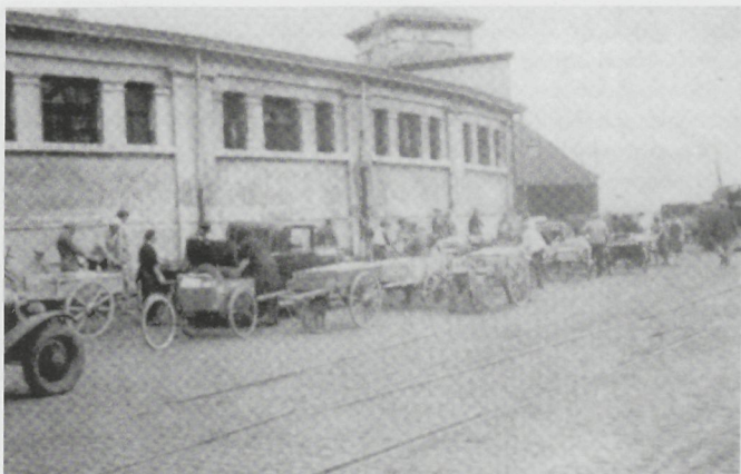
De Oostendse Vismijn van vóór 1934. Buitenaanzicht van de zgn. 'cierk', zo genoemd omwille van het ronde bouwsel. (Uit 'De evolutie van de Oostendse vissershavens' 1957.)

Zo'n oude brochure is bijzonder leerrijk. De Oostendse visserijvloot bestond in die vroege jaren vijftig uit bijna 200 vaartuigen. Vergelijk: vandaag klokt de héle Belgische vissersvloot af op minder dan negentig schepen. De Oostendenaars leverden in die tijd jaarlijks 55.000 ton voedsel. Vergelijk: dit jaar zet de héle Vlaamse visserij maar 15.000 ton meer op de marktloer. In 1975 was de Oostendse aanvoer nog goed voor 23.000 ton. Op het einde van de jaren tachtig was dat nog 12.000 ton en een absoluut dieptepunt werd genoteerd in 2001 met slechts 3.617 ton.