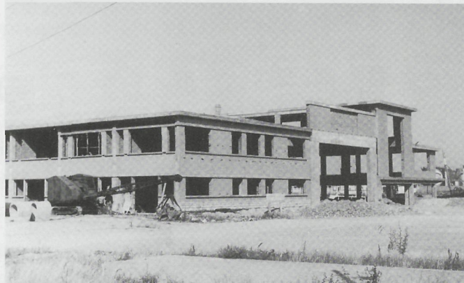
Na WO II werd in Oostende een nieuw vismijngebouw opgetrokken. Het zou een van de grootste en modernste uit zijn tijd worden

De twee vismijnen stonden na twintig jaar keiharde strijd ongeveer weer op het punt... waar ze twintig jaar ervoor ook al gestaan hadden. In 1985 mocht Oostende 46,5% van de aanvoer op het bord schrijven en na twintig jaar hevige vismijntwisten was dat 45,3%! Een verschil van nauwelijks iets meer dan 1%! Ook Zeebrugge stond weer op de plaats waar het in de jaren tachtig van vorige eeuw stond. In 2008 mochten ze daar 53,3% van de aanvoer op het bord noteren, terwijl dat in 1985 ook al bijna vijftig procent was. Een winst van 4%! Maar was dat een vooruitgang? Niet bepaald,