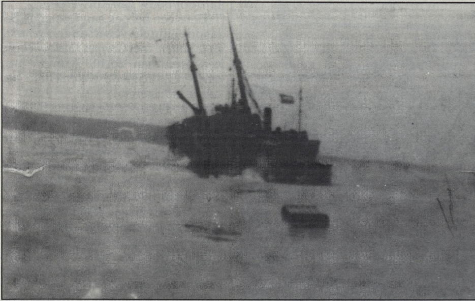
De Britse loodsenkotter sleept de O 275 uit de vaargeul.