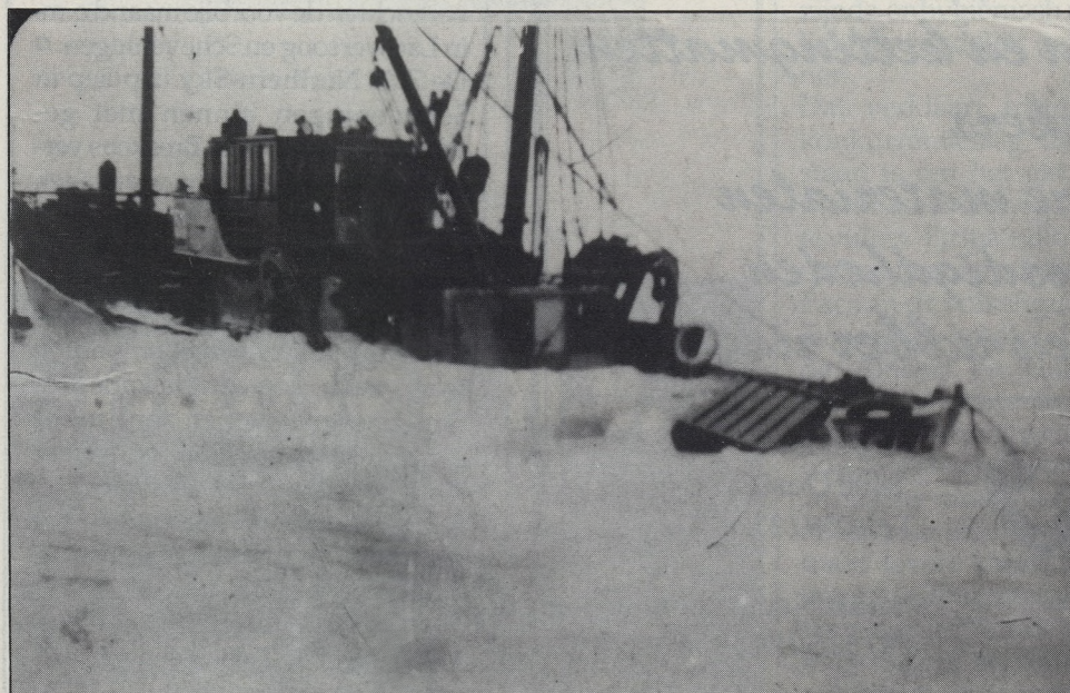
De 0.275 'Helene' zinkt na de ontploffing.