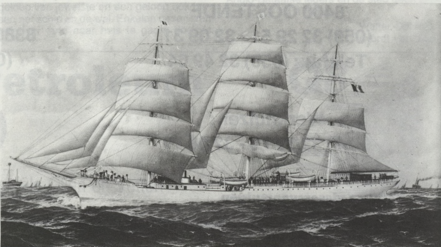
Portret van het Belgisch opleidingsschip „Comte de Smet de Naeyer” van de Rederij Belgische Zeevaartvereniging te Antwerpen (1906). Antwerpen, Nationaal Scheepsvaartmuseum.