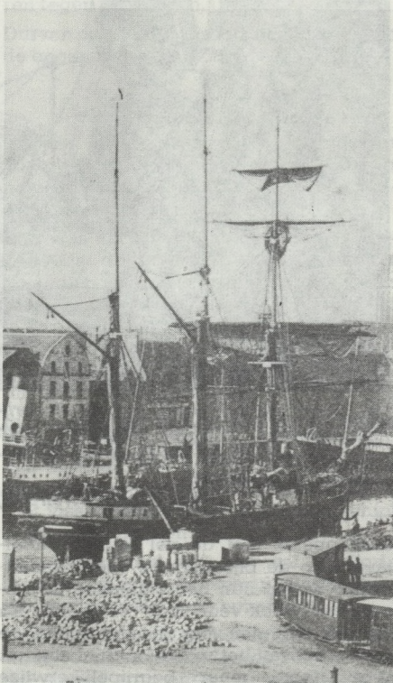
De Duinkerke driemaster „LULU ZAZA” aan de kade te Duinkerke.

In 1888 zou hij tijdens het bedrijven van de IJslandvisserij met man en muis vergaan zijn.