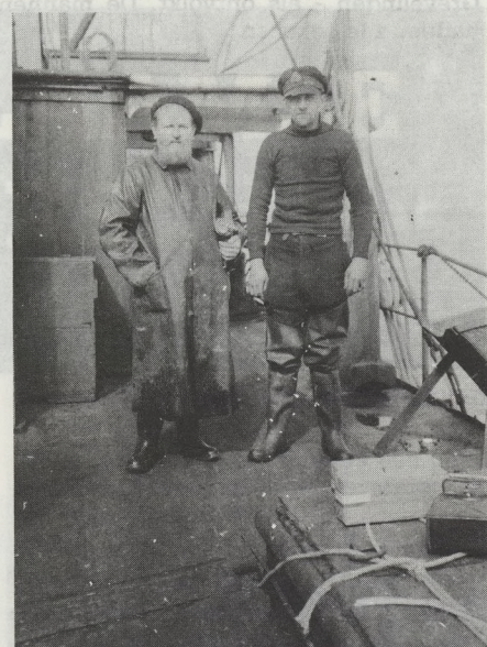
De „vent” van het schip met de visserij-aalmoezenier. Hoewel Fransen, toch goede kerels die de werklust van de Vlamingen waardeerden.

In de eerste dagen van de vaart werd vers brood gegeten en verse groentensoep opgediend, doch na de vierde dag waren