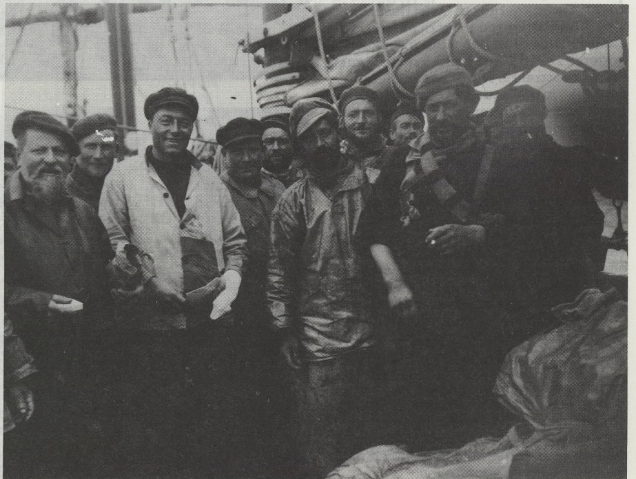
De bemanning van de „galette” L'ANGELUS, ruwe bonken met in hun hart veel heimwee naar huis.

Spoedig lag de Westkust - de West-Vlaamse kuststrook vanaf Westende tot