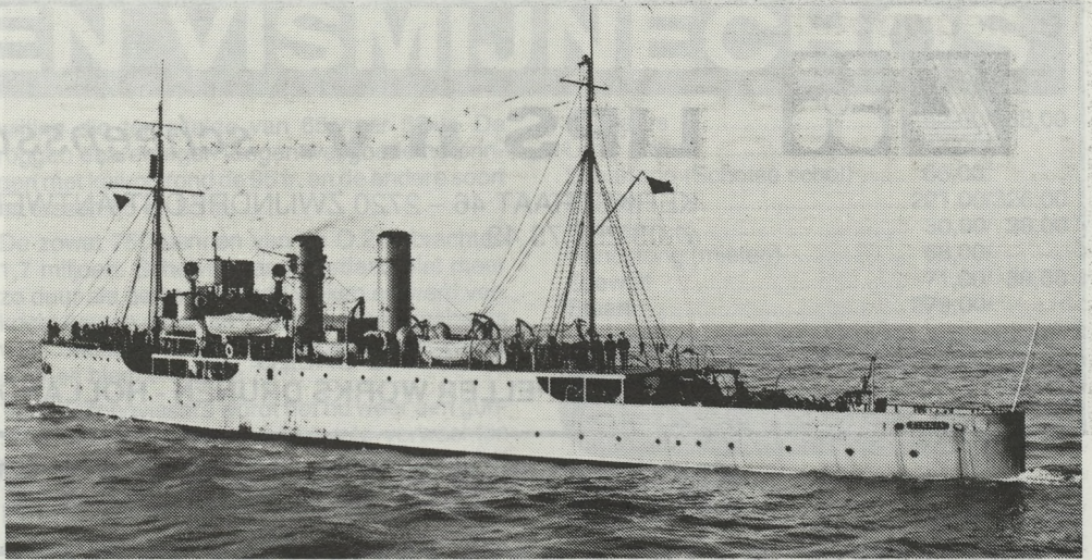
De „ZINNIA” op kruistocht in de Noordzee.

Deken Camerlynck, Paster Pype en de Grijze Zusters stelden onmiddellijk alles in het werk om de slachtoffers en de getroffen huisgezinnen zoveel mogelijk te helpen.