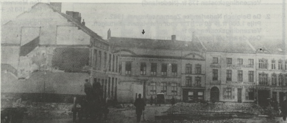
St. Andreas Vrije Vissersschool op het St.-Petrus en Paulusplein