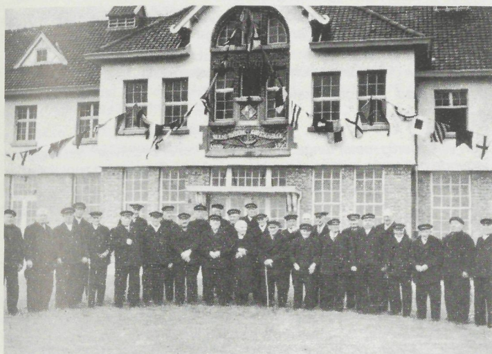
Het instituut „Helena en Isabella Godtschalck”.

In oktober 1956, betuigde Prins Alexander zijn grote genegenheid voor de vissersbevolking door zijn aanwezigheid bij de viering van het vijftigjarig bestaan van het Koninklijk Werk „Ibis”.