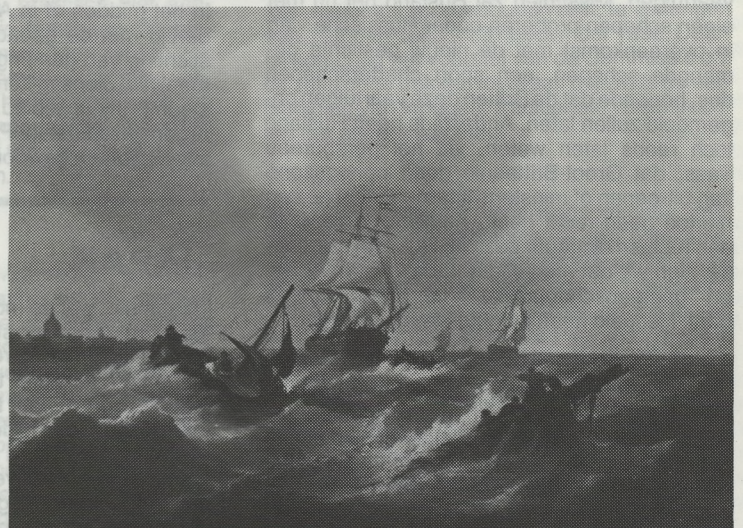
"SCHIPBREUKELINGEN VOOR DE KUST" (Knokke-Parijs, Berko Art Gallery)