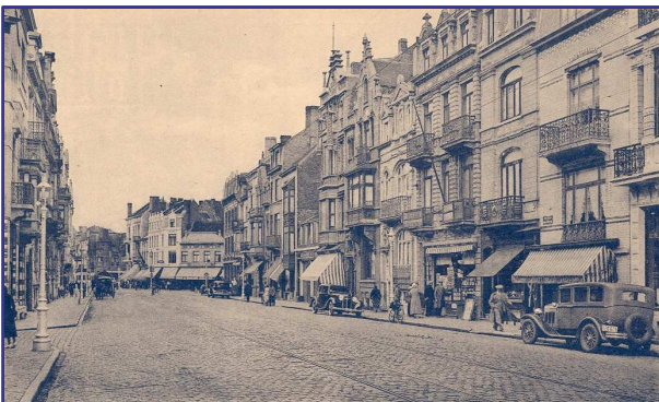
De Alfons Pieterslaan of "Boulevard du Midi" aan het begin van de 20ste eeuw

Dit jaar werd de Alfons Pieterslaan helemaal heraangelegd. Een reden om even stil te staan bij de geschiedenis van de straat en de naam ervan.