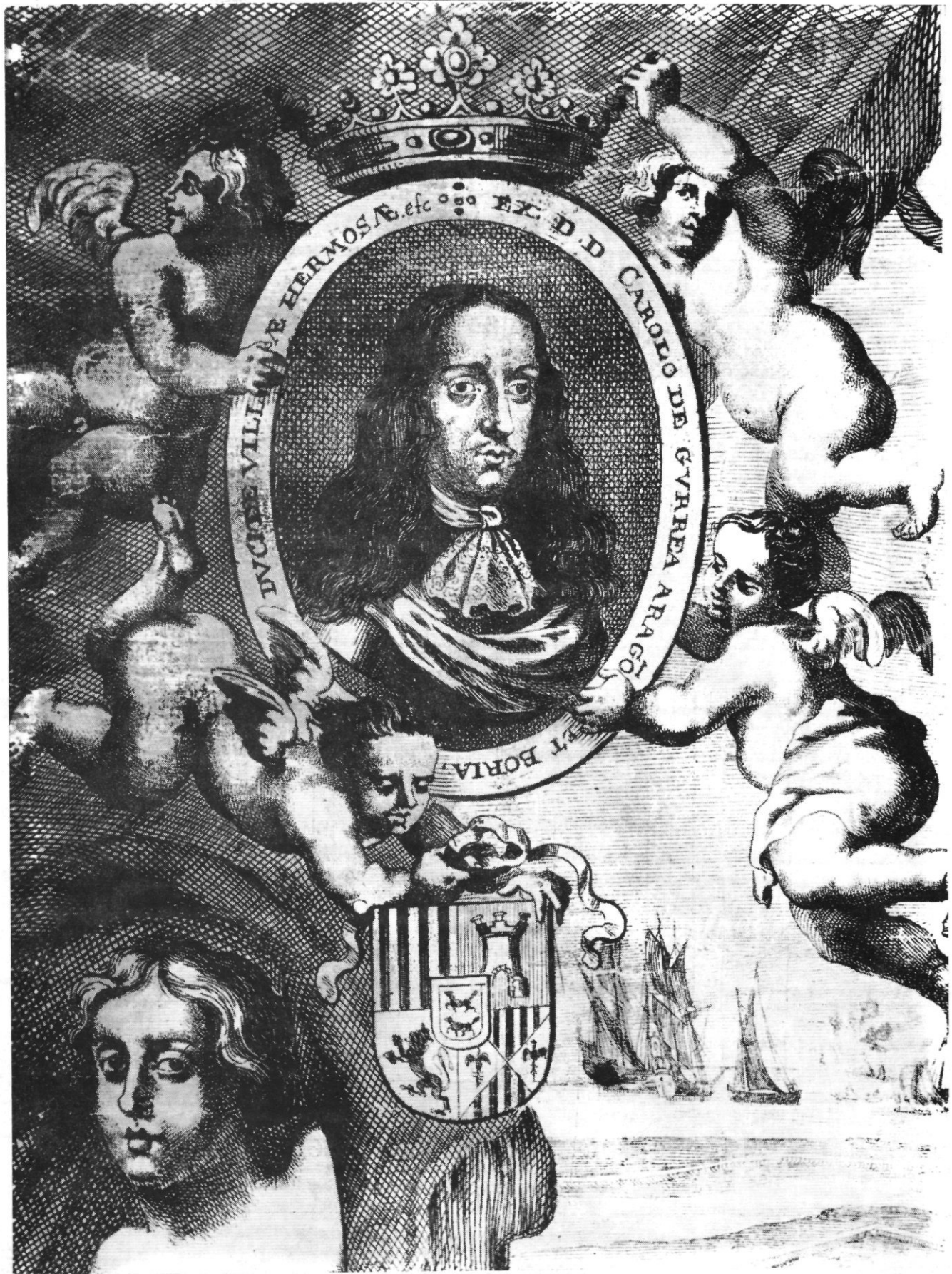
DE HERTOG DE VILLAHERMOSA.