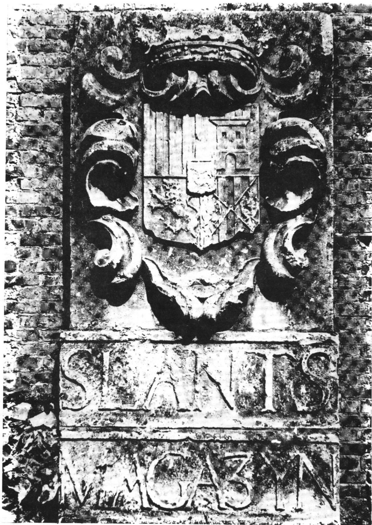
De steen SLANTS MAGAZYN in zijn huidige toestand.