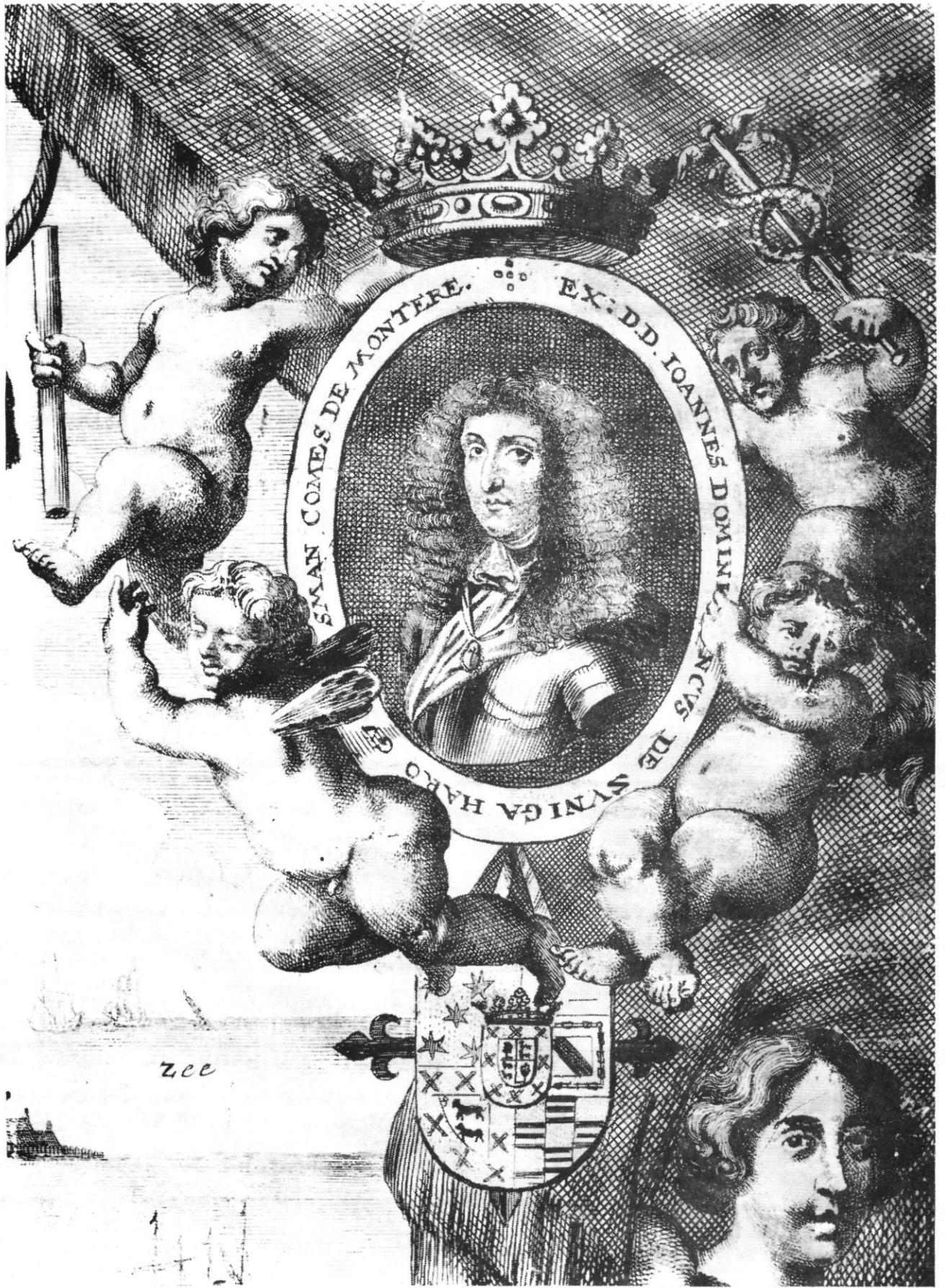
DE GRAAF DE MONTEREY.