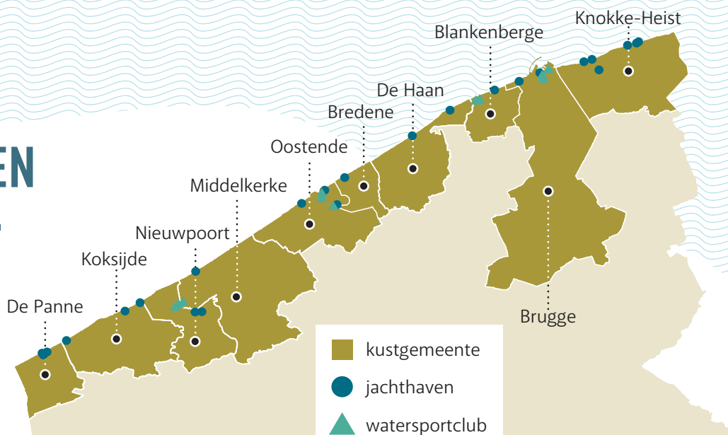
De ligging van de jacht- en watersportclubs langs de Belgische kust in 2018

De kustjachthavens zijn een belangrijke toeristische troef. Niet enkel voor de gebruikers van de jachthavens zelf, maar ook andere bezoekers vertoeven graag in de omgeving van een jachthaven of beachclub. De Vlaamse kust telt 12 jachtclubs in de vier kustjachthavens (Nieuwpoort, Oostende, Blankenberge en Zeebrugge) en 26 watersportclubs.