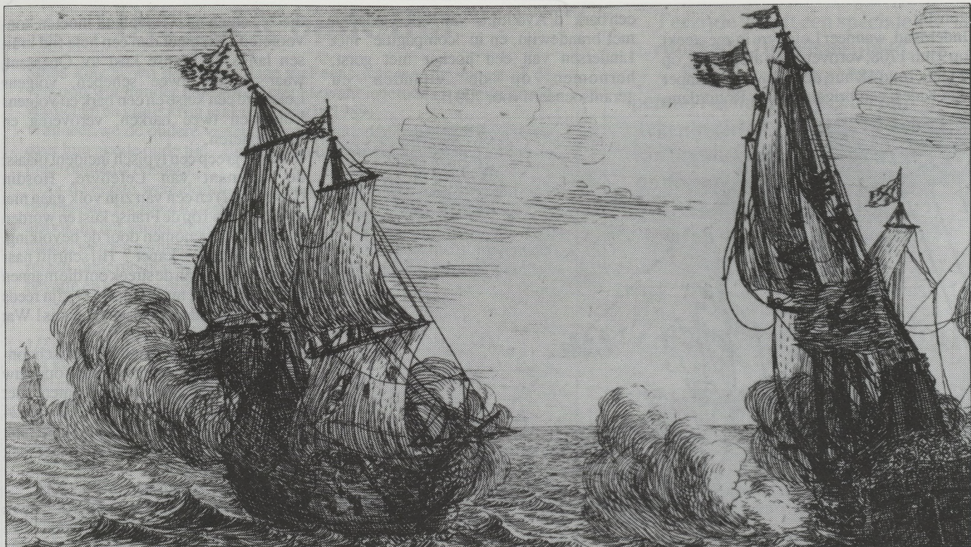
Twee Vlaamse fregatten met bourgognevlag (Kruis van Bourgondië) in strijd met een Hollands fregat (1652). Nationaal Scheepvaartmuseum Antwerpen.

scheperen, waar van 1 catte ende 1 galjoot was, ende wij het galjoot aen boord leyden, soo spronghen 7 man van ons over. In het aborderen creghen 1 van ons volcq gequest ende hielden het met een uyt de vloote met onse prijs."