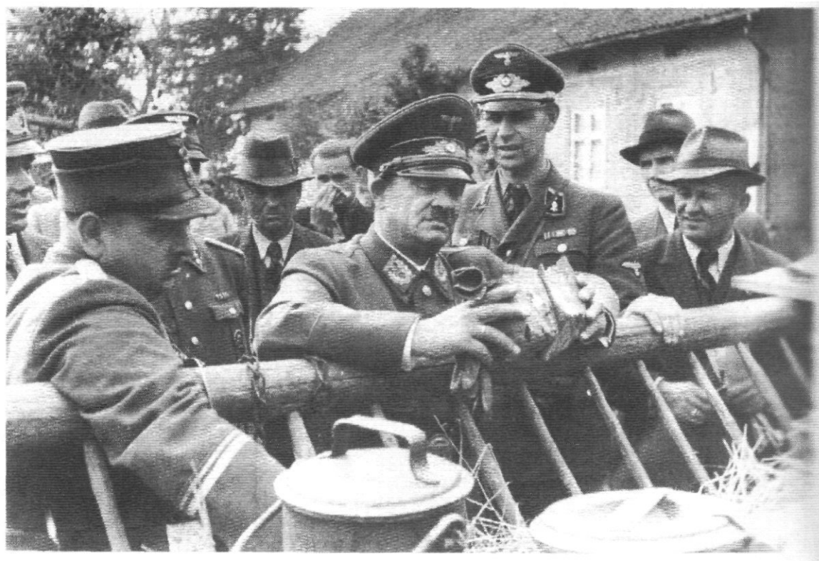
Augustus 1944: Gauleiter Koch (Oost-Pruisen) inspecteert de voedselvoorziening