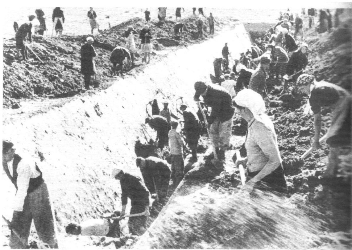
September 1944: "Einsatz" van vrouwen en bejaarden voor "Verteidigungsgraben"