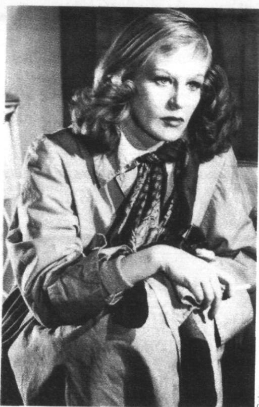
1947: Hildegarde Knef, het droombeeld van de naoorlogse "Fräulein"