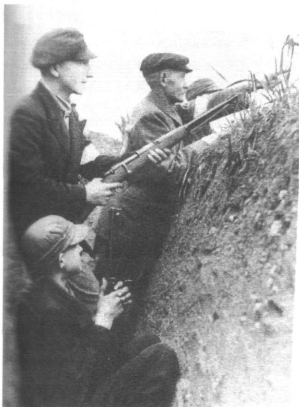
Oktober 1944: jong en oud, HJ en ook de "Volkssturm" in actie