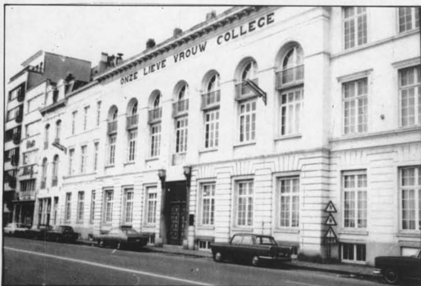
Het hoofdgebouw aan de Vindictivelaan zoals het er nu nog staat, anno 1977