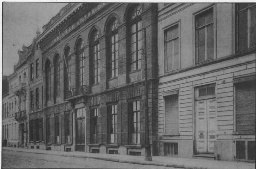
Het hoofdgebouw aan de Vindictivelaan, anno 1909.