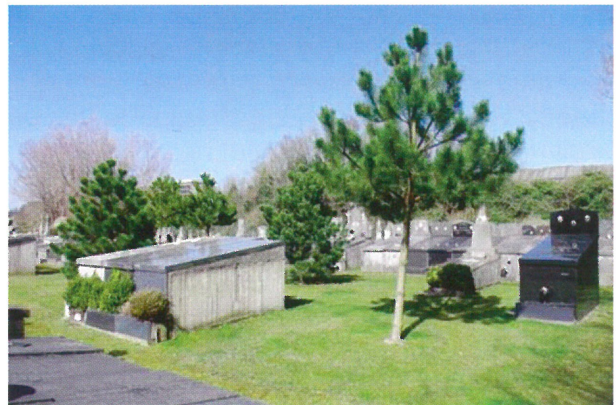
Begraafplaats Paster Pype. Het perk 08 waar in februari 2012 een eerste sanering plaatsvond. Men verwijderde 77 oude vervallen tombes, nivelleerde het terrein om vervolgens enkele bomen te planten (13).

Het staat als een paal boven water dat de revalorisatie van de Begraafplaats Paster Pype en het bouwen van een crematorium een tijd lang onlosmakelijk samengingen. Natuurlijk kun je de wind niet van richting veranderen, maar wel de stand van de zeilen. Elf jaar na de bekendmaking door het stadsbestuur aangaande het bouwen van een crematorium en waarbij onverbiddelijk gekozen werd voor een locatie naast de begraafplaats, is er plots een nieuwsbericht in het weekblad 'De Zeewacht' van 13 november 2009 waarin burgermeester Vandecasteele de keuze van de locatie nu eerder genuanceerder ziet. 'We kijken ook naar andere locaties', leest het hoofd van het persbericht en waarmee het harde standpunt van de burgervader herleid werd tot een optie.