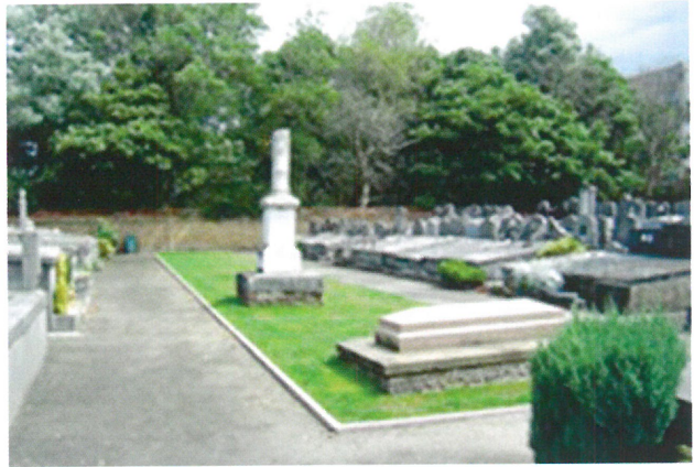
Met aanleg van groeneilandjes werd getracht wat rust te brengen in de ruïneuze toestand. De foto toont een realisatie uit 2005 door de toenmalige dienst Begraafplaatsen.

worden met aanduiding van de nog vigerende concessies met omschrijving van de bouwfysische staat van het grafteken. De norm voor beoordeling werd als volgt toegepast: herstelbaar of definitief bouwfysisch vervallen . Finaal, op aanvullende vraag van de schepen, werd nog een tweede lijst opgemaakt. Deze lijst bevatte de tombes waar met 01 november bloemen of bloemstukken waren neergelegd. Zo kreeg je vast de indruk, aldus de schepen Tulpin, hoe nabestaanden stonden tegenover het graf van hun afgestorvene. De samengebrachte data, deze van de werkgroep en wat opgemaakt was in opdracht van schepen Tulpin werd door het Hoofd van de begraafplaats, in plattegronden grafisch gebundeld.