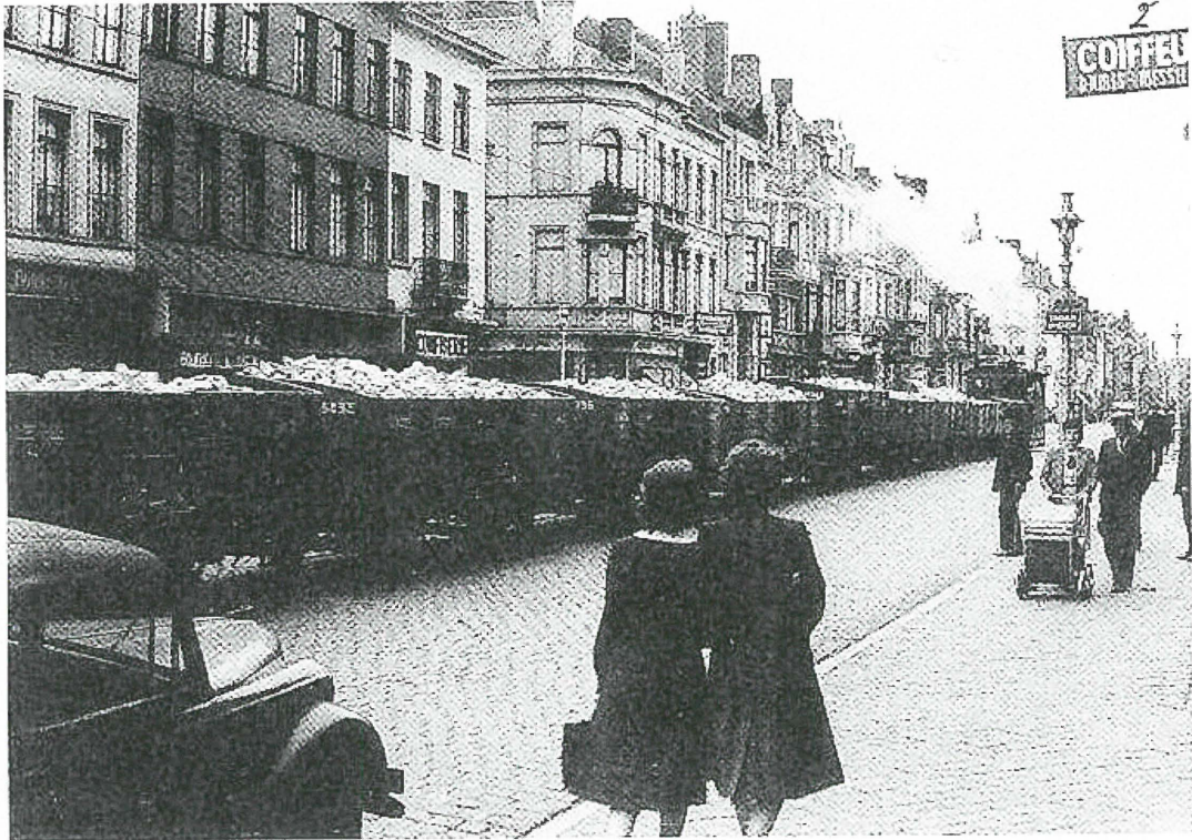
1943, stoomtram in de Aflons Pieters laan