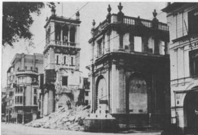
Puinen, een bunker of water van het Postgebouw in 1945 overbleef