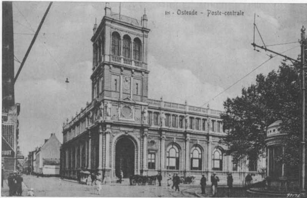
.... Zoals een Spaans paleis (1905)