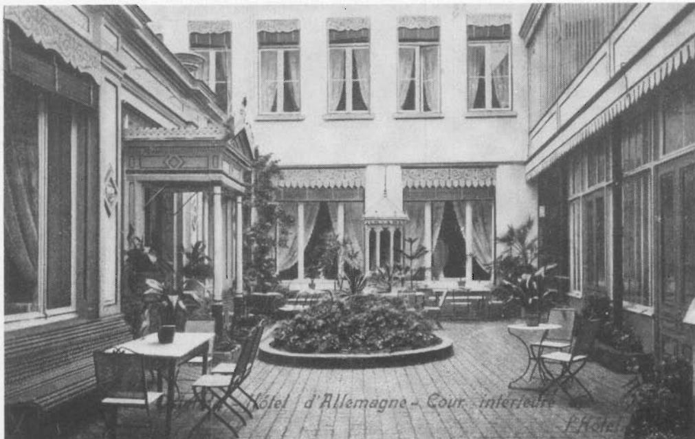
De luxueuse binnenkoer van het "Hotel d'Allemagne" (circa 1900).