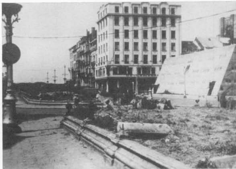
De reuzeschuilplaats voor het Kommandantur (Hotel du Parc, Marie-Joséplein).