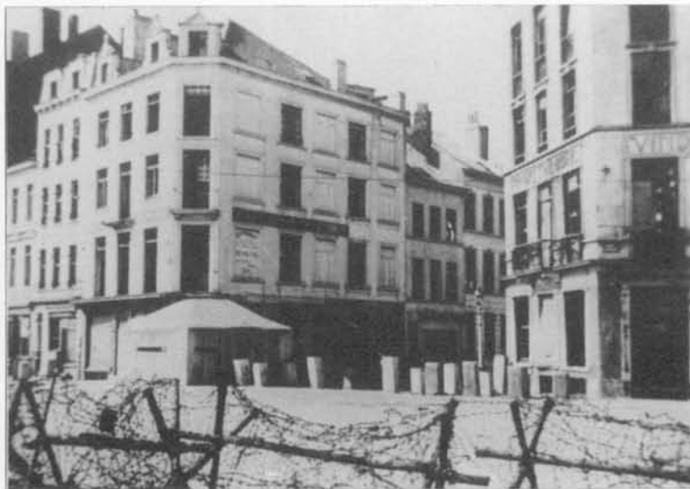
Nabij de Visserskaai: prikkeldraad, betonpalen en mitrailleursest om de toegang tot de binnenstad te beletten.