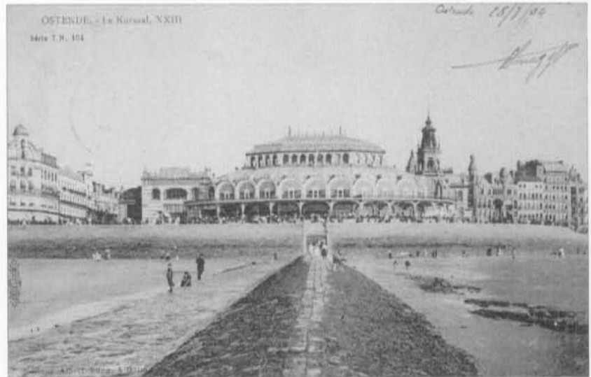
De transformatie van 1895. Eén torentje is reeds klaar.