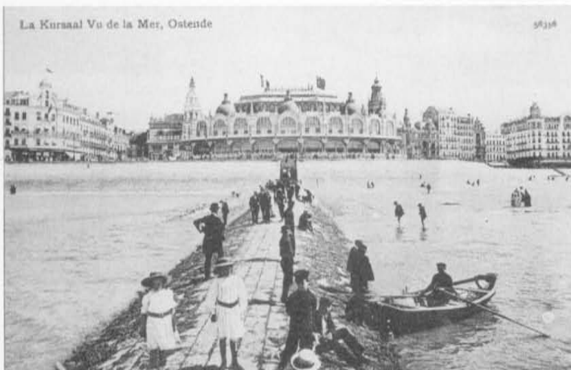
De transformaties beëindigd in 1905. Twee torentjes, andere glasramen, enz.