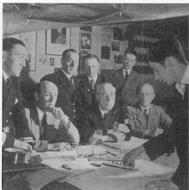
Eindexamen ! Voorzitter van de examercommissie is de Belgische inspecteur voor de Scheepvaart. Rechts achter hem de Directeur van de school.

De namen van de personen op de onderste foto's zijn ons onbekend. Indien één van onze lezers een persoon moest herkennen dan mag de naam medegedeeld worden aan het Secretariaat van de Plate.