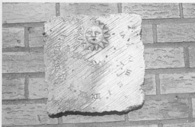
Poolstijlzonnewijzer van het verticale type Prins Roselaan 115 Oostende