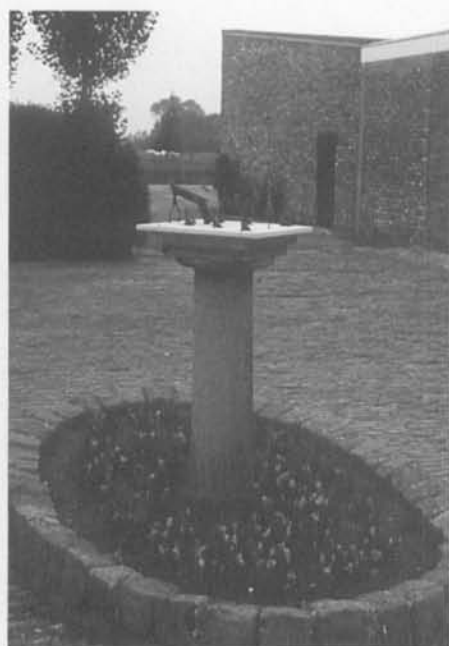
De zonnewijzer van Snellegem