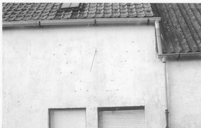
Poolstijlzonnewijzer van het verticale type Verloren Kost 42 Snaaskerke