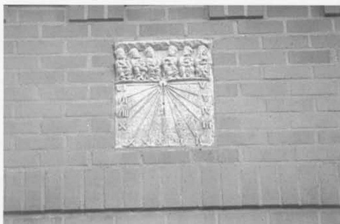
Poolstijlzonnewijzer van het verticale type Vaartstraat 21 Oudenburg