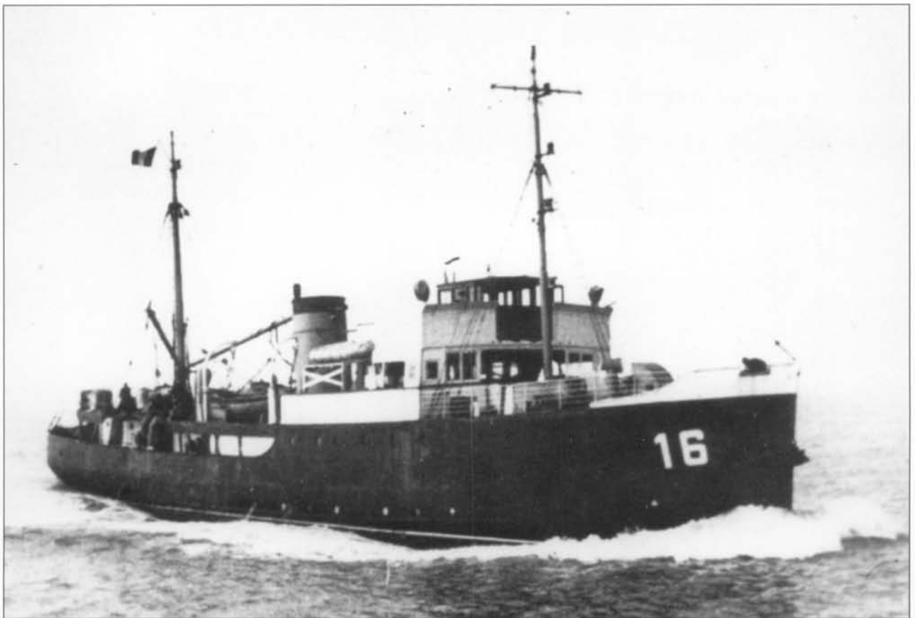
Loodsboot 16 werd vanaf 12/12/1940 omgebouwd tot patroeljevaartuig 'Kernot'.