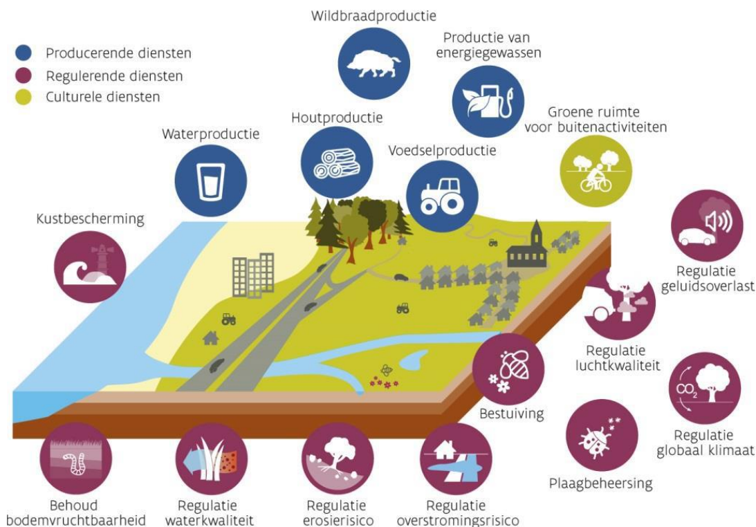
Figuur 1 Zestien ecosysteemdiensten in Vlaanderen

Door de onderwaardering van natuur en biodiversiteit raken ecosystemen en de ecosysteemdiensten aangetast. Het belang van natuurlijke ecosystemen als bron van voedsel, drinkwater of hout is duidelijk. Andere ecosysteemdiensten zijn veel minder zichtbaar zoals water- en luchtzuivering of de bestuiving van gewassen en het behoud van vruchtbare bodems. Zulke minder tastbare ecosysteemdiensten bepalen mee ons welzijn en onze welvaart, maar worden niet altijd (h)erkend of correct gewaardeerd. Door die onderwaardering raken ecosystemen en de diensten die ze leveren steeds verder aangetast. Zo verliezen we diensten waarvan we afhankelijk zijn en moet de samenleving een hoge prijs betalen voor extra gezondheidszorg, natuurherstel en technische oplossingen voor milieuproblemen.