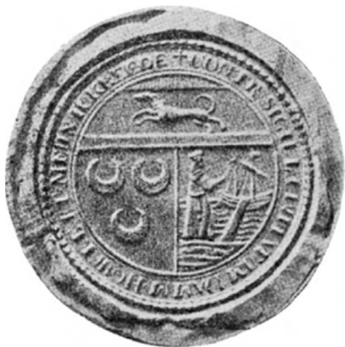
Zegel van de vereenigde steden Damme, Monikerede en Hoeke. (XVIII e eeuw. Museum Gruuthuse, Brugge).

Eindelijk in 1594 werd aan deze vraag gevolg gegeven en werden Monikerede en Hoeke bij het schependom van Damme gevoegd. Ieder van de afgeschafte steden was vertegenwoordigd door een eigen schepene in de wet van Damme.