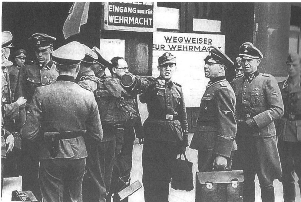
2 september 1944: aftocht naar de Heimat