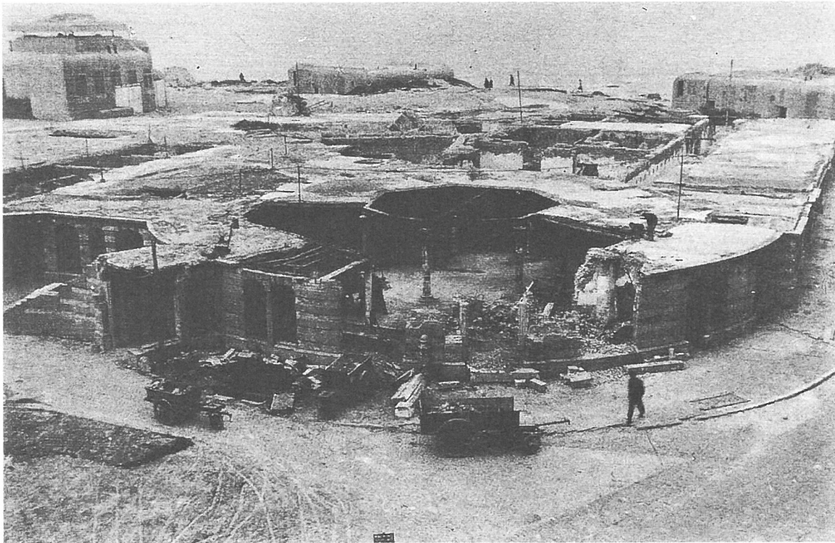
September 1944: hier stond ooit het Kursaal