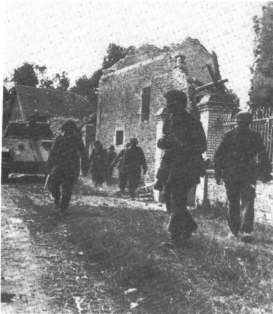
Augustus 1944: "Pantzergrenadiere" in Normandië