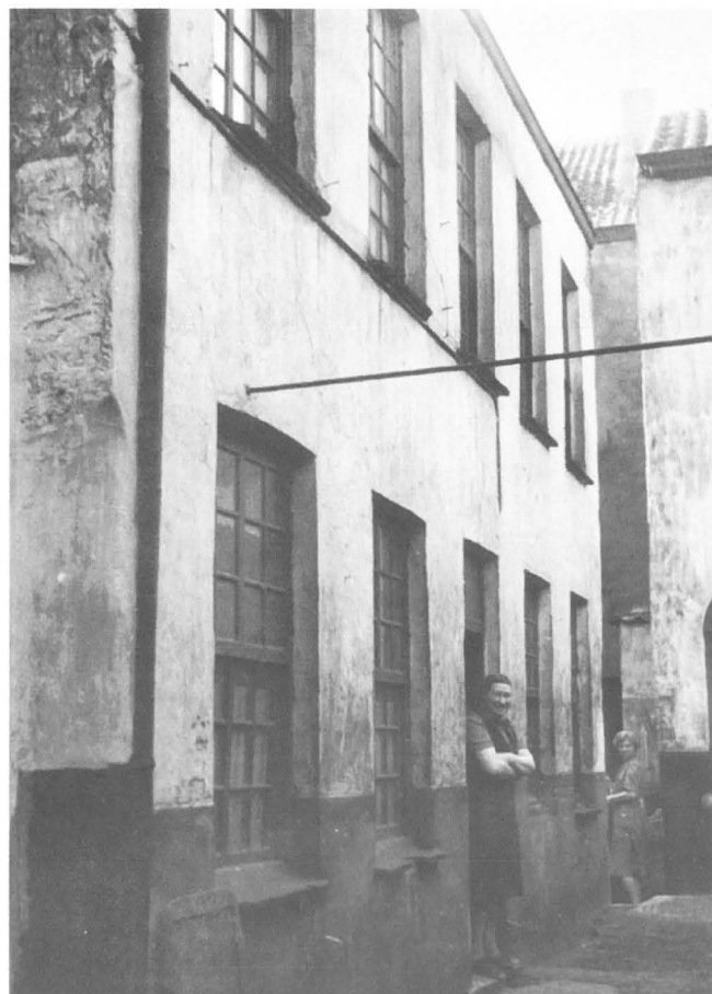
Slop in de Sint-Franciscusstraat, gevestigd met ingang naast café "Gent". Deze laatste was gelegen op de hoek van de Paulusstraat en de Sint-Franciscusstraat