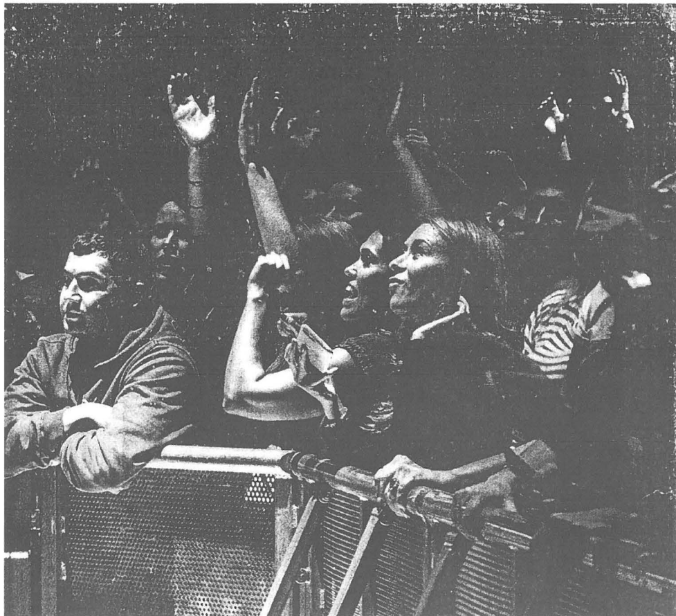
2016: "Scnur" fans in Sint-Petersburg