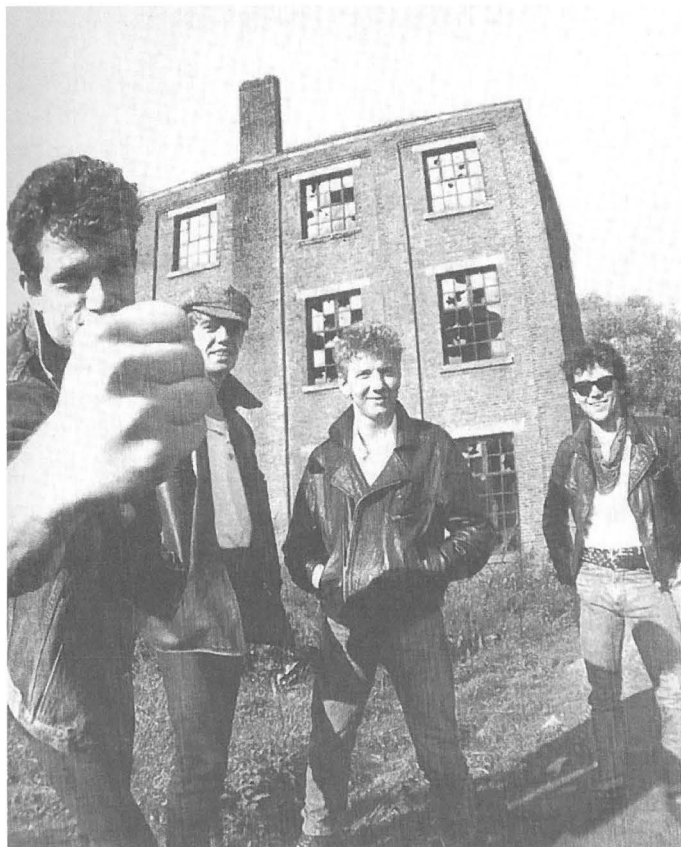
1983: The Scabs: revolterende rock