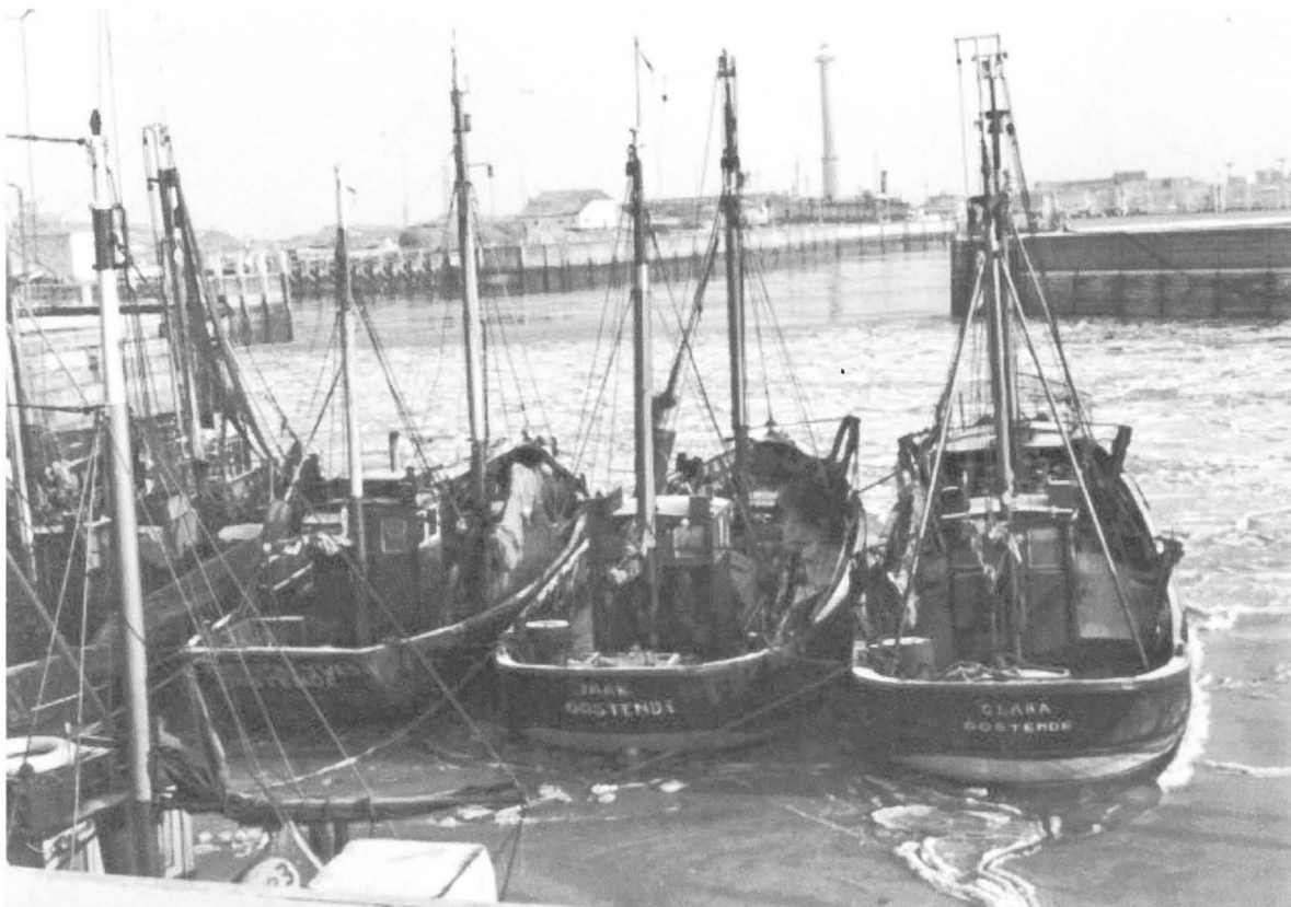
1963. Het Montgommerydok

De illustraties komen uit de collectie van Roger Jansoone en van Eddy Serie