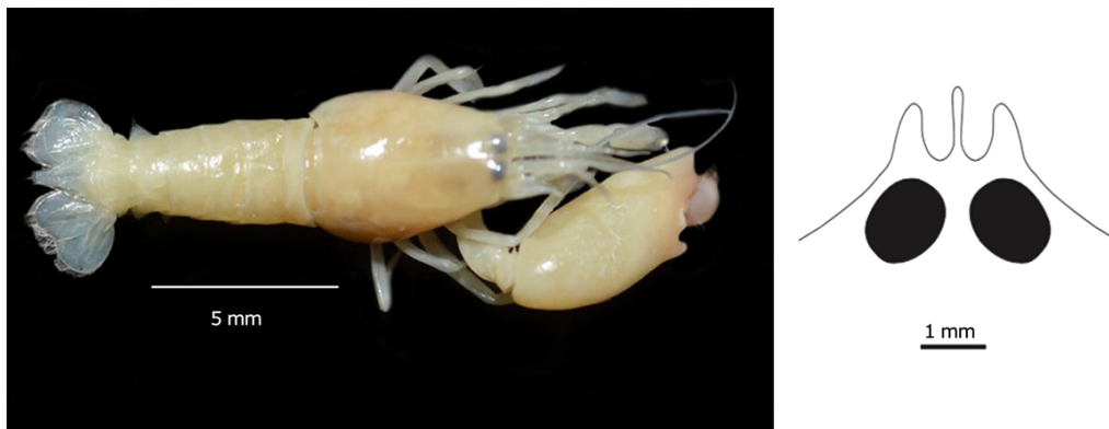
Figura 3. Synalpheus pandionis . Macho colectado dentro de la esponja Aiolochoira crassa en el Parque Nacional Arrecife Puerto Morelos, México / Male collected inside the sponge Aiolochoira crassa in the Parque Nacional Arrecife Puerto Morelos, Mexico