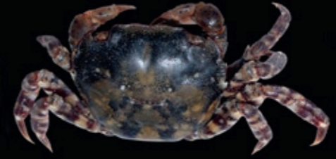
B 45 mm 17