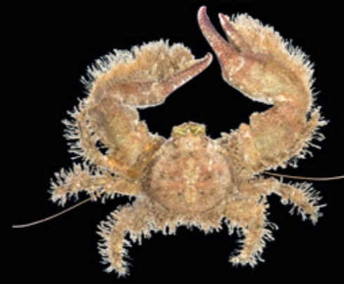
L 16 mm 5