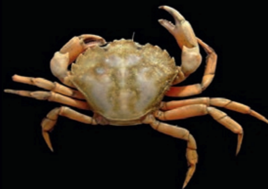
L 80 mm 8