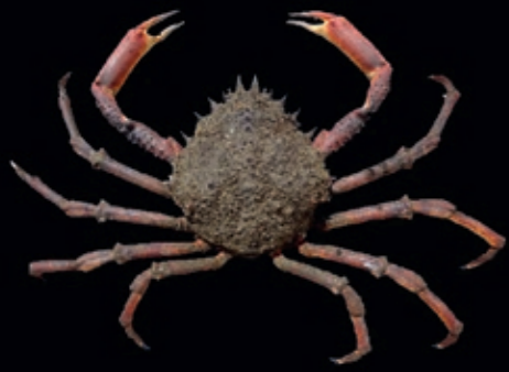
L mannetjes 225 mm, vrouwtjes 160 mm 19