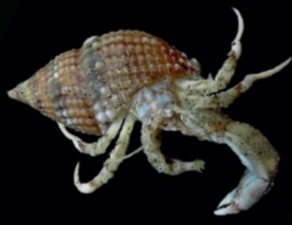
L 10 mm 1