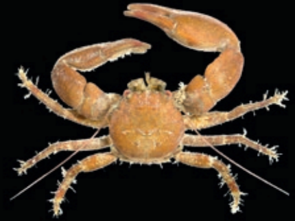
L 30 mm 6