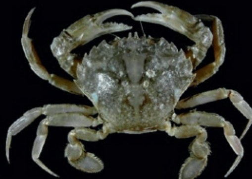
L 40 mm 18