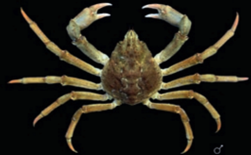
B 80 mm 15