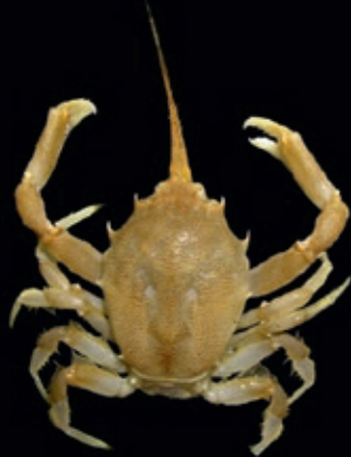
L mannetjes 40 mm, L vrouwtjes 34 mm 7