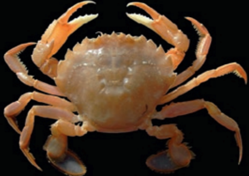
B 35 mm tot 57 mm 9