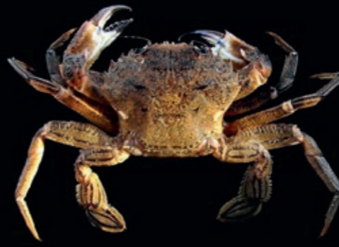
B mannetjes max 102 mm, vrouwtjes max 90 mm 10