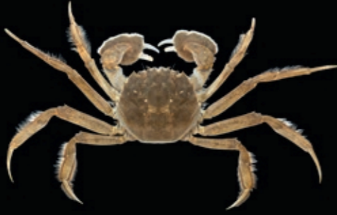
B 85 mm 14