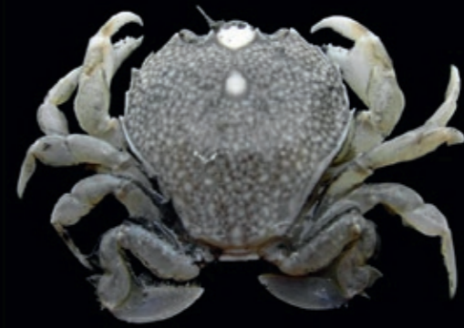
L en B max 32 mm 11