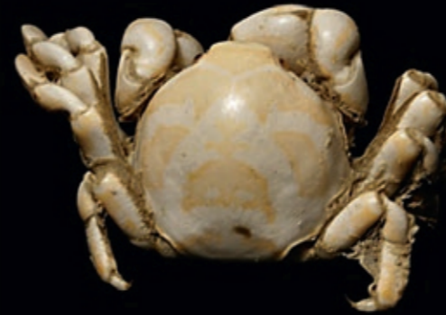
B mannetjes 8 mm, vrouwtjes 14-18 mm 16