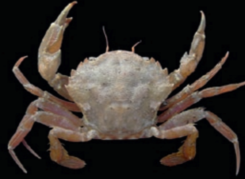
L mannetjes 46 mm, vrouwtjes 38 mm 22