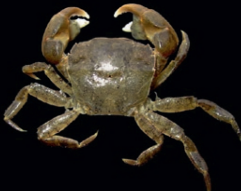
B 28 mm 13