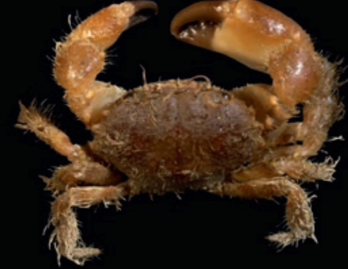
B 25 mm 12