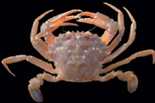
L mannetjes 67 mm, vrouwtjes 56 mm 21