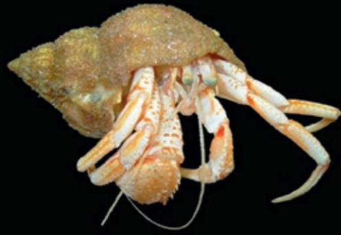
L 36 mm 2