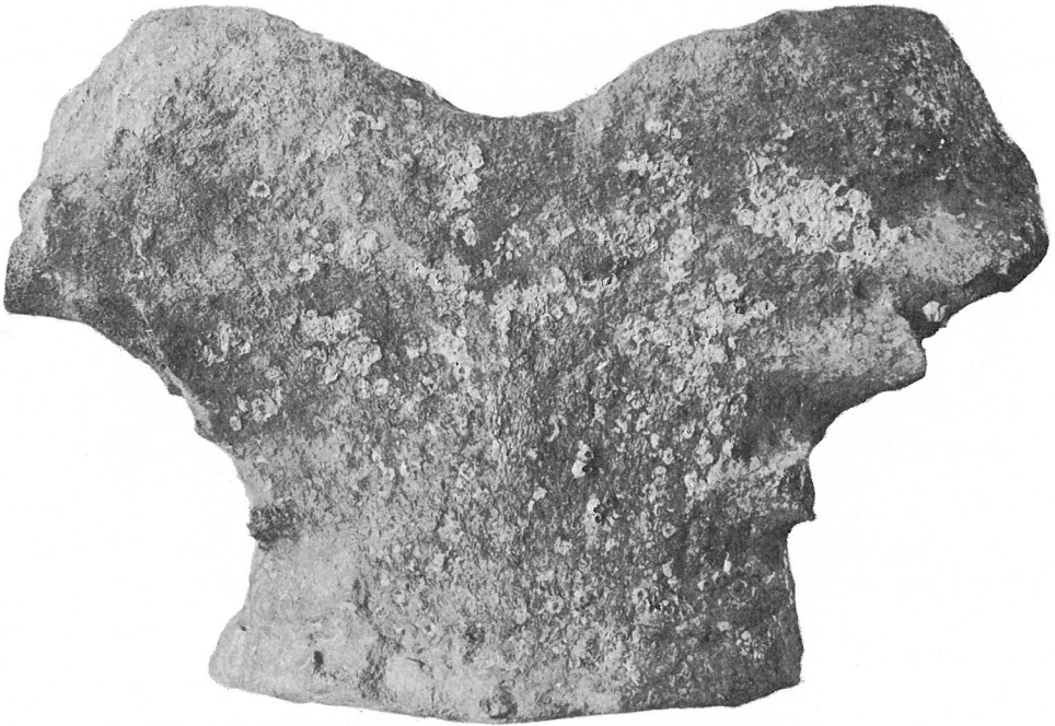
Fig. 1. — Balaena belgica , les sept vertèbres cervicales.

Cette disposition est due au fait que le trou occipital, ainsi que les deux condyles ont glissé plus fortement vers la partie mésiale de la base du crâne chez les Balaenidés que chez les Balaenoptéridés.