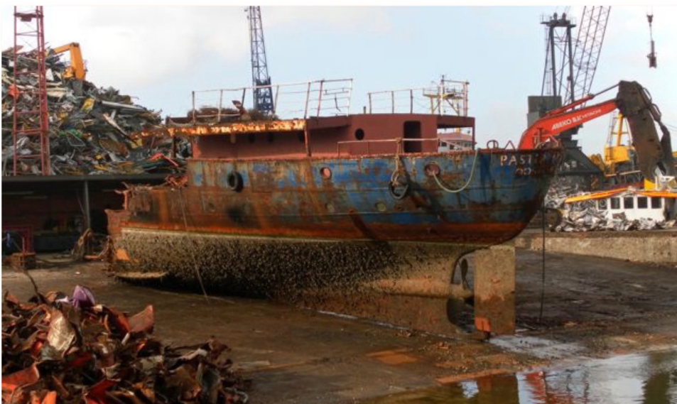
Een laatste blik op achtersteven van de Paster Pype, reeds voor de helft gesloopt. Uiterst rechts zie je ook nog een restant van de brug van de Zeearend onder de sloopschaar.