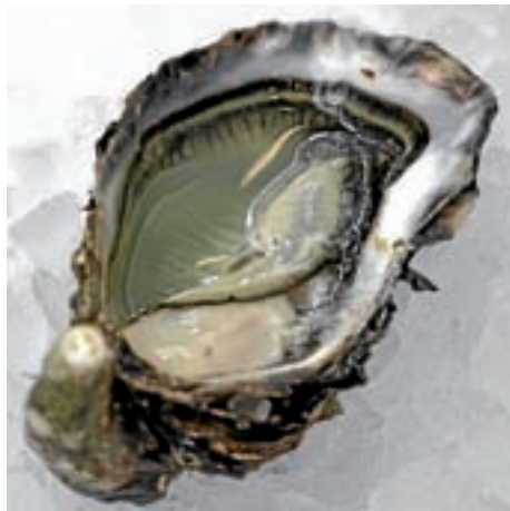
■ Een epidemie onder de platte oester rond 1922 die voor massale sterfte zorgde in de Engelse kwekerijen, was het startsein voor de Belgische kwekers om met andere (holle) oestersoorten te gaan experimenteren (zoals de Portugese oester). Vanaf de 1960-er jaren zou de Japanse oester zelfs een monopolie veroveren op de Europese markt (wikipedia)

Het plots verdwijnen van de Engelse platte oester legde de achilleshiel van de Belgische oesterteelt bloot: de afhankelijkheid van buitenlandse import. In 1933 besliste de Bestendige Commissie voor Zeevis en Oestercultuur dan ook om te onderzoeken of een integrale oesterkweek mogelijk was aan onze kust. Bij een integrale kweek beperkt de teler zijn arbeid niet langer tot het pure vetmesten van ingevoerde dieren, maar streeft hij naar het voltrekken van de volledige levenscyclus in Belgische wateren. In de Nieuwpoortse Vlotkom en de Oostendse Spuikom gingen in de loop van de jaren 1930 verschillende kwekers aan de slag met deze integrale oesterteelt. De eerste vaststellingen leken positief. De uitgezette platte oesters uit Frankrijk en Zeeland plantten zich uitstekend voort in de beide kommen. Ook het oesterbroed vestigde zich zonder probleem op de grote hoeveelheden gekalkte dakpannen. Deze waren als 'verzamelaars' van het broed verspreid aangebracht in het water van de