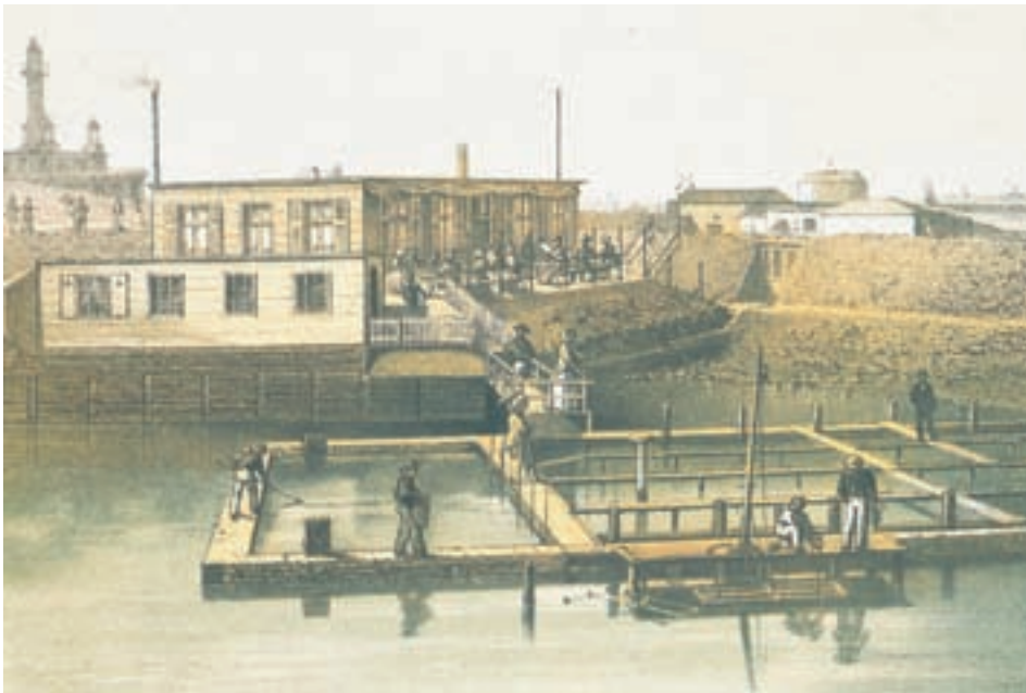
■ Het absolute hoogtepunt van de Ostendaise situeert zich net vóór de Eerste Wereldoorlog. In 1912 werden niet minder dan 35 miljoen oesters geveit in Vlaamse putten. Op dat ogenblik was de glorie van het "Pavillon Musin" (Oostende: zie foto) echter al voorbij (De Vent 1991)

echter sterker dan ooit uit deze crisis en beleefden hun absolute hoogtepunt net vóór de Eerste Wereldoorlog. In 1912 werden niet minder dan 35 miljoen oesterexemplaren geveit in de putten aan de Vlaamse kust. De nijverheid bood in die periode werk aan zo'n 275 mensen, waaronder gespecialiseerd personeel dat instond voor het vakkundige onderhoud van de installaties. Daarnaast vonden ook heel wat mandenvlechters, kistenmakers en kuipers werk bij het vervaardigen van speciale verpakkingen voor het oestertransport. De Grote Oorlog van 1914-1918 maakte een einde aan al deze bedrijvigheid en betekende het begin van de teloorgang van de vermaarde Belgische schelpdieren.