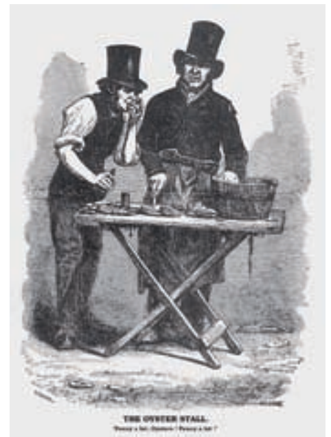
■ In de tijd van Charles Dickens waren oesters nog armeluzenkost. Geleidelijk aan werden ze echter een ware hype en schoten de prijzen de lucht in. Afgebeeld is een oesterstalletje in Londen, daterend van rond 1864 ( www.esterleederberg.com )

Algauw exporteerden Oostende, Nieuwpoort en Blankenberge jaarlijks miljoenen oesters met exprestreinen naar onder andere Frankrijk, Rusland, de Balkanstaten en de Duitse en Oostenrijkse gebieden. De Belgische schelpdieren mochten in deze periode onder geen beding ontbreken op de menu's van de Europese upper class. Deze status van de oester als prijzig luxeproduct was trouwens een vrij nieuw verschijnsel. Tot rond het midden van de 19 de eeuw waren deze schelpdieren immers op vele plaatsen nog echt volksvoedsel, net als mosselen en wulken op straat te koop. In 1822 kon men in Gent bijvoorbeeld voor de prijs van één gevulde kalkoen maar liefst 600 oesters aanschaffen. Ook Charles Dickens betoogde in 1836 nog dat 'oesters en armoede altijd samengingen'... Enkele decennia later bleek van deze stelling niets meer te kloppen. De steeds toenemende vraag naar de platte oester bleef immers niet zonder gevolgen.