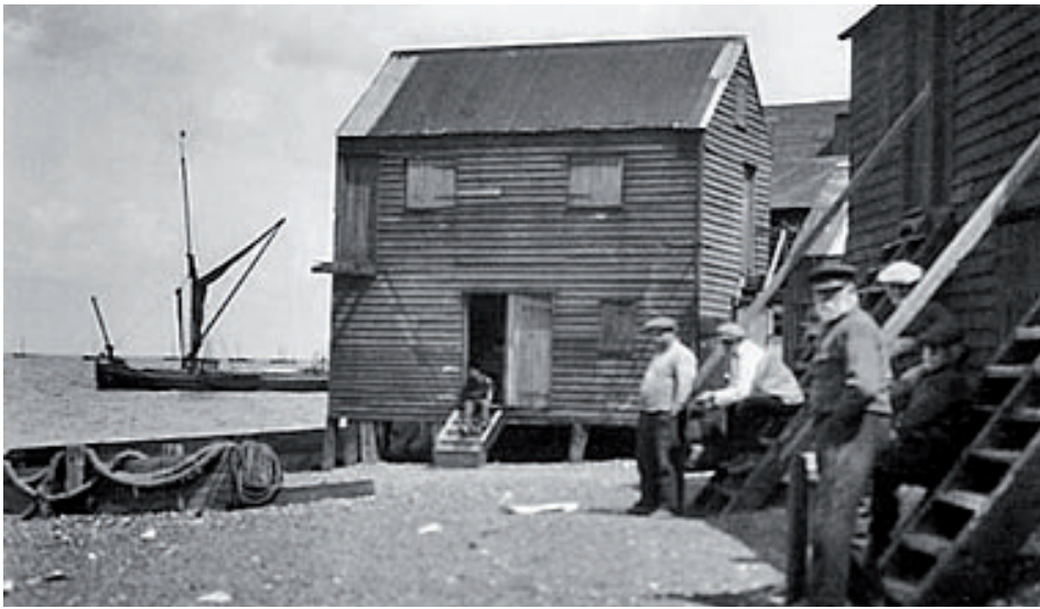
Vlaamse oesters waren afkomstig van Engelse oesterbedden, van waaruit ze met schepen tot hier werden gebracht om ter plaatse vetgemest te worden. Stadjes als Whitstable, Burnham en Colchester vormden een belangrijk oorsprongsgebied. Hier een historisch beeld van een opslagplaats voor oesters in het kuststadje Whitstable

Een sluiensysteem voorzag de weekdieren op regelmatige basis van vers voedselrijk water. Reeds na enkele maanden toonden zich de heilzame effecten van deze methode: uit het water kwamen vlezige, blanke en sappige oesters tevoorschijn, dé kenmerken van de befaamde ‘Ostendaises’.