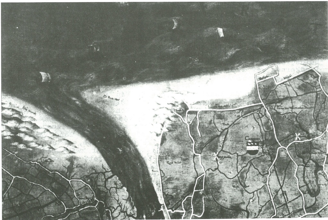
Fig. 4: de schorren van het Hazegras, de Zvingeul en de Zandpolder op de Grote Kaart van het Brugse Vrije door Pieter Pourbus de Oudere (1571).

De opeenvolging van verschillende kaarten illustreert tenslotte duidelijk de oostelijke verplaatsing vanaf 1570 van de Zvingeul. Op de Grote Kaart van het Brugse Vrije van Pieter Pourbus uit 1571 ligt de diepe Zvingeul nog steeds tegen de oude kern van de Hazegraspolder. Deze schorren werden in de cijnspachtovereenkomst van Jean de Baenst in 1428 reeds beschreven. De Zandpolder is in 1571 nog volledig onaangetast. In 1723 rest er echter nog slechts een klein buitendijks deeltje van deze 150 jaar voordien imposante polder en wordt het achterliggende land van Cadzand fel bedreigd door de oostelijke verplaatsing van de Zvingeul. Dit toont fraai hoe de Zwinstreek tot 200 jaar terug nog een levende delta vormde, waar landwinning hoe dan ook nooit als een definitieve overwinning op de zee mocht beschouwd worden. Waar de huidige Zvingeul opnieuw verzandt, lag eens een duinenrij en een belangrijke polder.