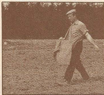
In het boek wordt zowel aan de mens als aan de natuur aandacht besteed.