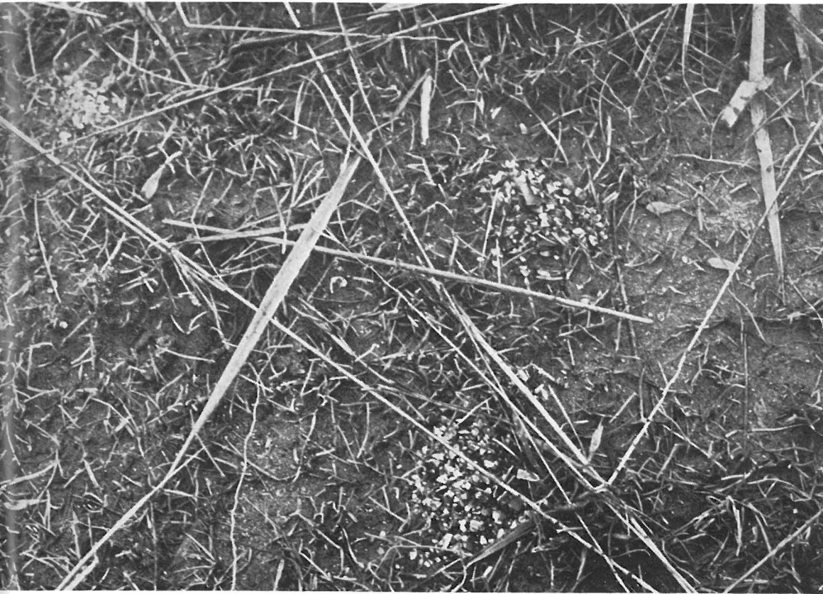
Zwin : mantelmeeuwen hebben de schalen van de daags voorheen verorberde schelpdieren uitgebraakt...