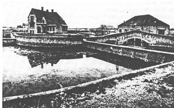
Nieuwpoort Villa — Parc aux Heibea 118 Nieuwpoort Stad — Oesterputten

Na St Michielskermis werd de kutter versast en bleef 's winters in de Brugse Vaart liggen met neergestreken masten. Meteen werd het touwwerk en het zeiltuig nagezien en de boot "zijn verf gegeven", in afwachting van de komende meimaand.