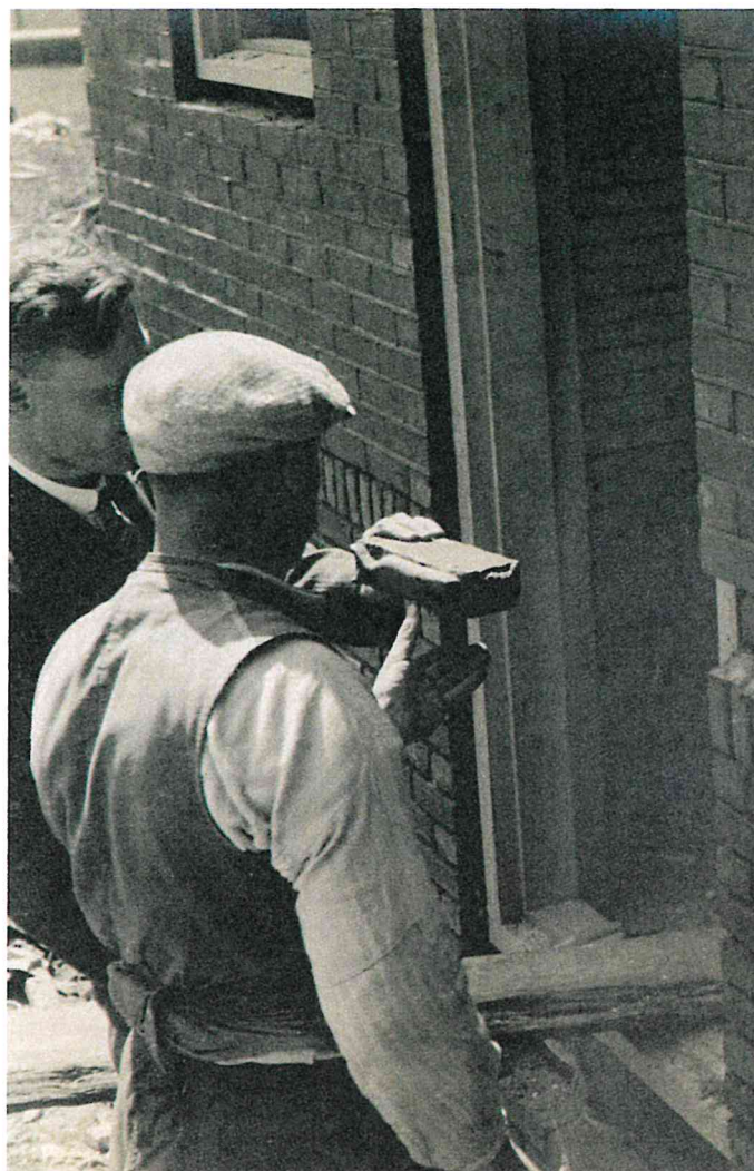
De Potvissteen van Ter Pelkwijk wordt ingemetseld in het gastenverblijf.

een verslag en foto's. Op 16 november spoelt een derde exemplaar aan op de Beer bij Hoek van Holland. Hier gaat van Deirse met een aantal gymnasiasten 'jeugdige natuurliefhebbers', heen op woensdagmiddag. Helaas zijn ze er niet bij hoogwater, zodat ze er niet dichtbij kunnen komen. Ze nemen wel enkele op het strand gevonden baleinen en een rib mee die ze nog dezelfde dag schoonmaken op het gymnasium. Dit is het begin van van Deirse's uitgebreide walviscollectie. Op 24 november spoelt nog een vierde exemplaar aan, nu bij Bergen aan Zee. Ook hier gaat hij heen, maar pas op 2 december. Toen bleek dat er al veel gesloopt was van dit exemplaar. Daarbij had men inwendig resten van een 7,5 centimeter grote granaat gevonden. Al deze vinvissen waren oorlogsslachtoffers, voor onderzeeërs aangezien en beschoten of met een drijvende mijn in aanraking gekomen. De vinvis van Wissekerke was het mooiste exemplaar dat van Deirse kon bestuderen.