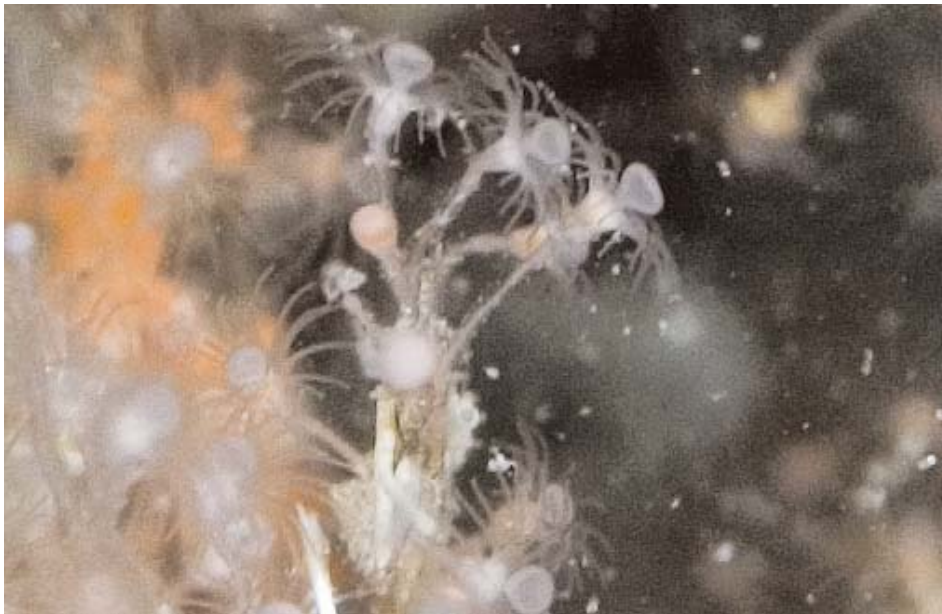
Foto 2 (zie pag. 61). Eudendrium arbuscula.