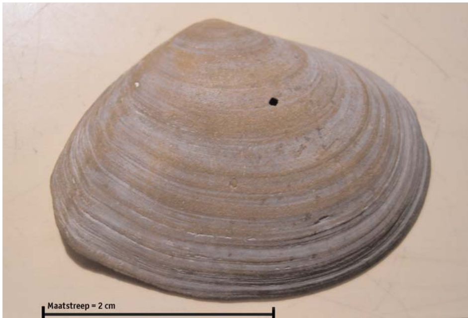
Foto 1. Ovaal nonnetje ( Macoma calcarea ) van Ameland.