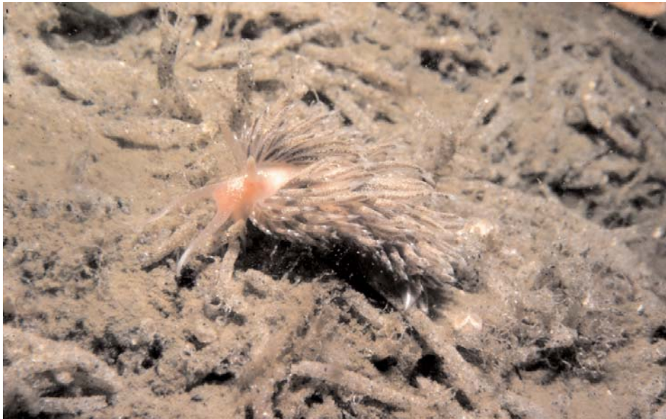
foto 4. Facelina bostoniensis , Marsdiep Texel 4 juli 1978 (foto: Godfried van Moorsel, ecosub).