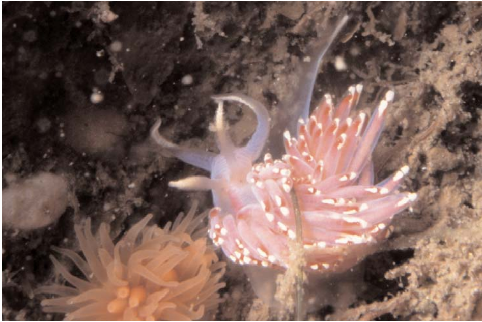
foto 3. Facelina auriculata , Gorishoek 8 oktober 1998.